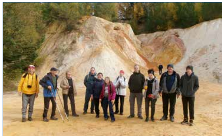
» V barvách stěn kaolínového lomu