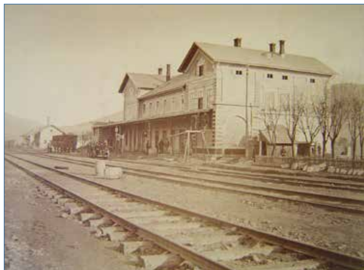
» Zdice - nádraží za přestavby, rok 1875