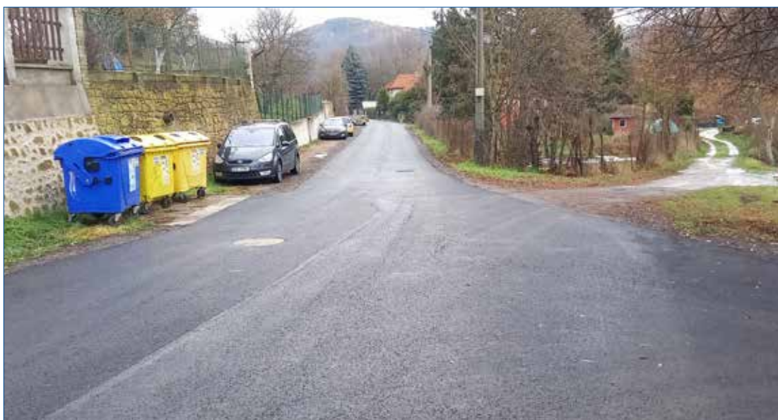
» Nový povrch v ulici Našich Mučedníků.