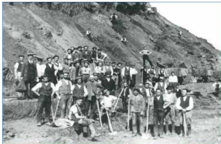
» Výkop zářezu pro železniční trať Zdice - Libomyšl realizovaný kolem roku 1920. Tím byl odstraněn nebezpečný vjezd do stanice původně vedenou trati kolem vápenky.