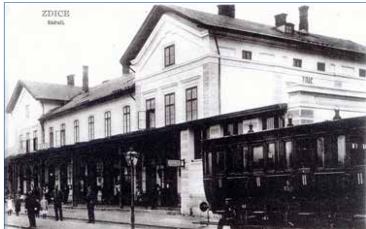
» Zdice - nádraží do roku 1905