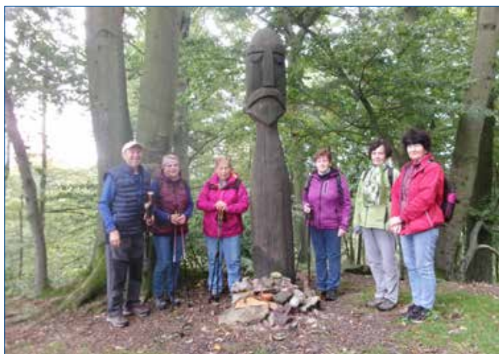
» Čestná stráž u Velese

obdivovat. Přijždíme do Světců u Tachova, kde nás ohromí krása, po Vídni druhé největší jízdárny, a to jak citlivě je opravena. Na cestě do Tachova ještě vystoupáme na rozhlednu Vysokou a Knížecí alejí podél Mže přicházíme do historického centra Tachova. Tady se loučíme i s Českým lesem v muzeu, jehož expozice jsou mu věnovány.