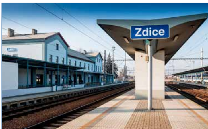
» Zdické nádraží v současnosti.