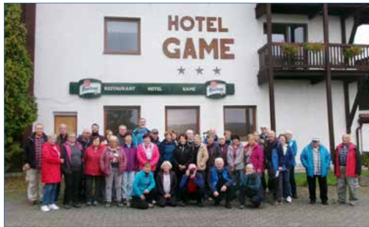
» Naše výprava na Chodsko a do Českého lesa