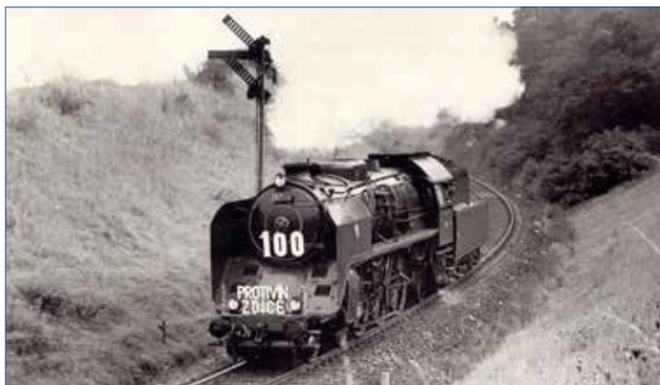
» 387.043 u vjezdového návěstidla ŽST Zdice - na otočení do depa Zdice 05-1975.