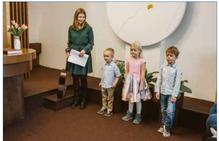
» Děti z mateřské školy s paní učitelkou při vystoupení.