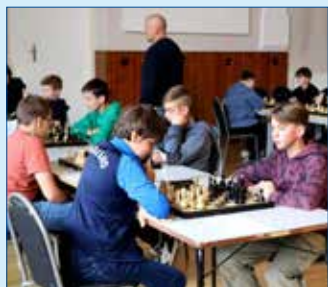
» Svatováclavský turnaj

Začátkem října odstartovaly dlouhodobé soutěže družstev dospělých. Náš oddíl má tři týmy ve třech soutěžích: krajský přebor (ŠK Zdice A), regionální přebor (ŠK Zdice B) a regionální soutěž (ŠK Zdice C). Zahá-