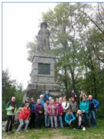
» U Jana Sladkého Koziny