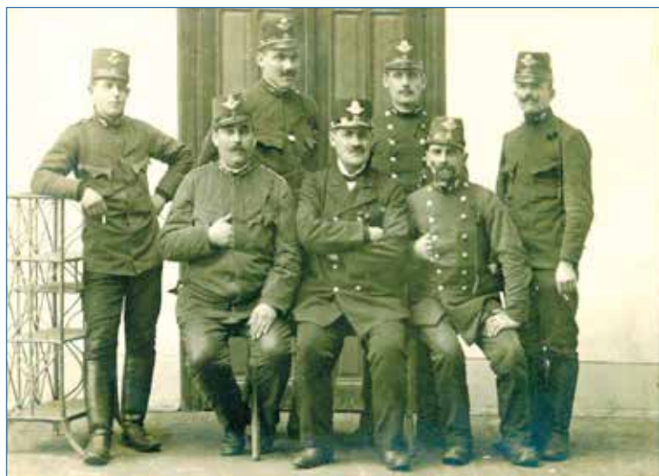
» Železniční zaměstnanci v letech rakousko-uherské vlády.