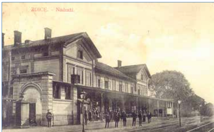
» Zdice - dobová pohlednice 1914, sb. Švihla