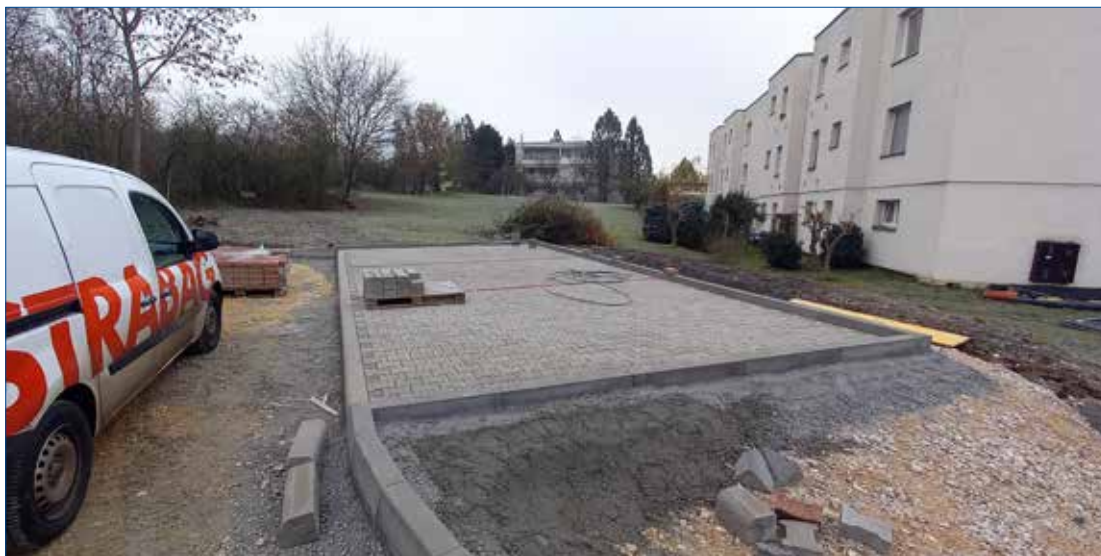
» Dokončování parkoviště u hřbitova.