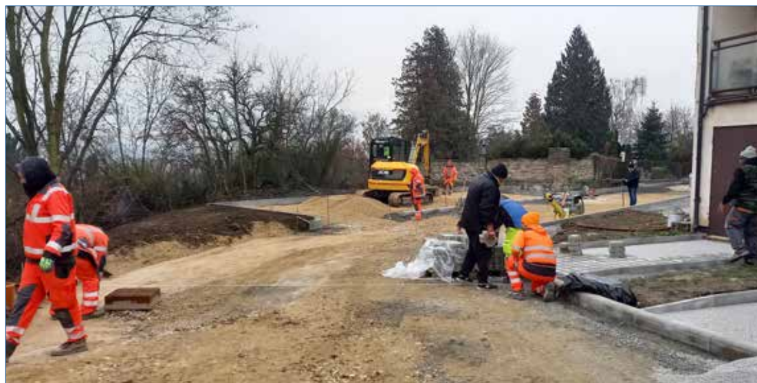
» Realizace opravy ulice Velizská a navýšení parkovacích míst