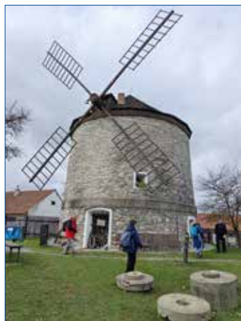
» Větrný mlýn v Rudicích