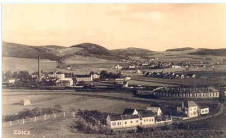
» Pohled na nádraží a výtopnu Zdice po roce 1925