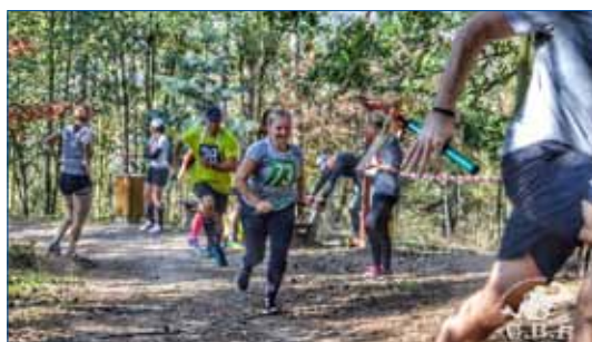
► Účastníci Královského stoupáku. Na snímku vlevo závod štafet, který doprovázela hezká atmosféra.