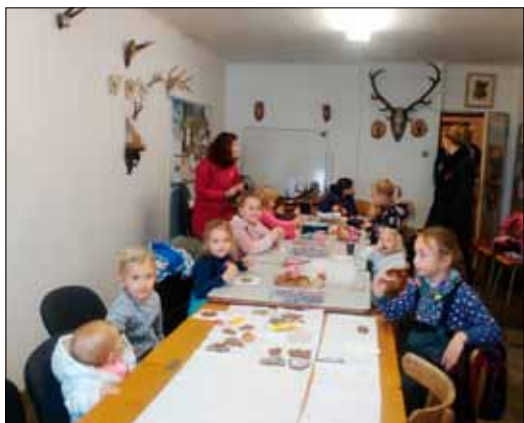
» Děti v Knížkovicích pod dozorem svých maminek vytvářely v příjemné atmosféře vánoční dekorace.