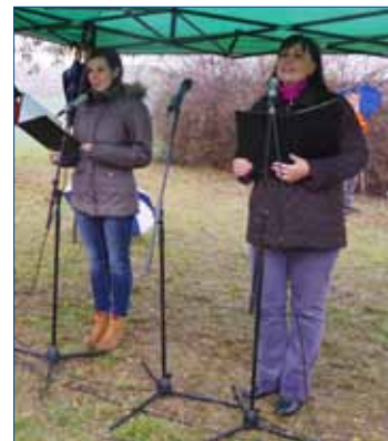
» Zpěvačky skupiny POKUS.