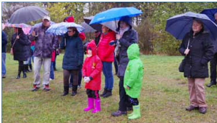
» Počasí 28. října vládla zima a déšť.