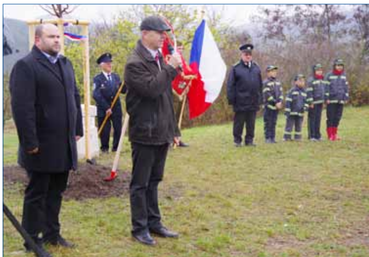
» Čestnou stráž drželi členové Army Zdice a členové SDH, včetně nejmenších.