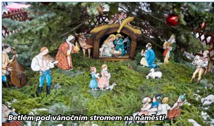
Betlém pod vánočním stromem na náměstí