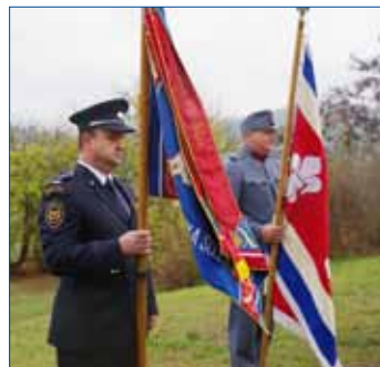
» Čestná stráž se slavnostními prapory při sázení lípy ve Zdicích.