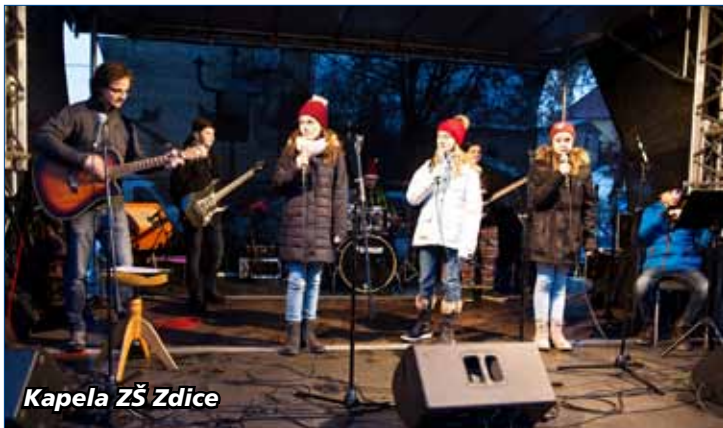
Kapela ZŠ Zdice