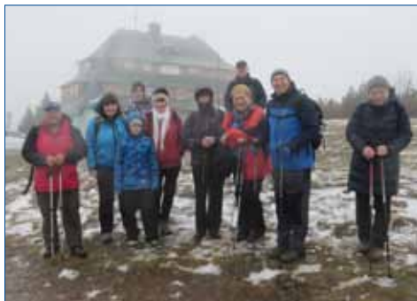
» Je to vidět, jsme posilněni.

P.S.: Kdo z vás si oblíbil promítání filmů z našich turistických akcí, které v městské knihovně dáváme pod názvem, „Výlety a výletníci ve filmu“, zakroužkujte si prosím v kalendáři čtvrtky 17. ledna, 14. února a 14. března příštího roku.