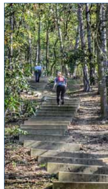
► Nejtěžší to měli závodníci na schodech.