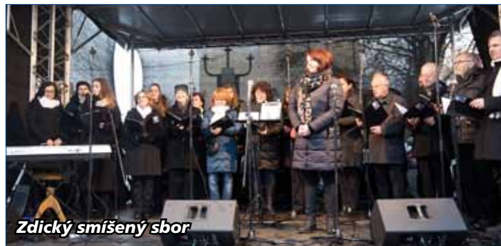
Zdický smíšený sbor