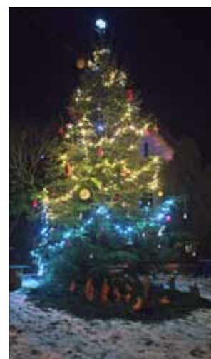
» Osadní výbor v Knížkovicích organizuje ve spolupráci s ostatními rodiči setkání u vánočního stromu, které proběhlo v sobotu 1. prosince na návsi. Součástí ozdobeného vánočního stromu v Knížkovicích je i překrásný betlémek. Povedlo se! Nádherná atmosféra Vánoc v Knížkovicích začala.