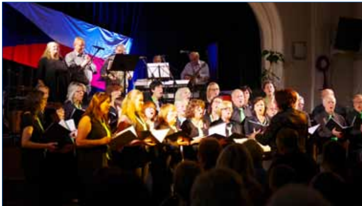
» Zdický smíšený sbor a Dixieland band Zdice.