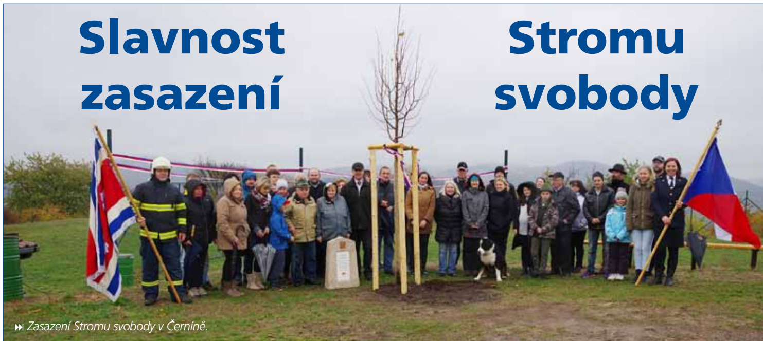
» Zasazení Stromu svobody v Černíně.