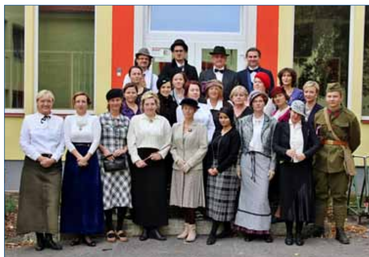
► Učitelé se převlékli do dobových kostýmů.