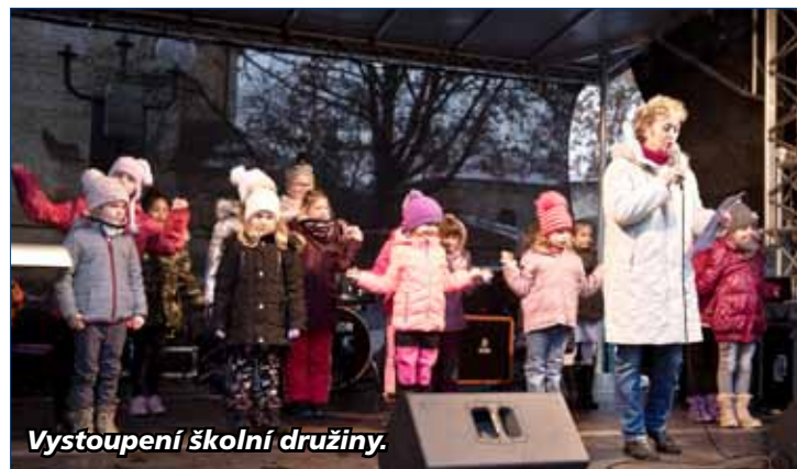
Vystoupení školní družiny.