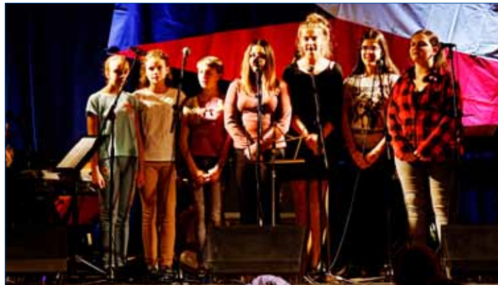
» Zpěvačky letošní kapely ZŠ Zdice.