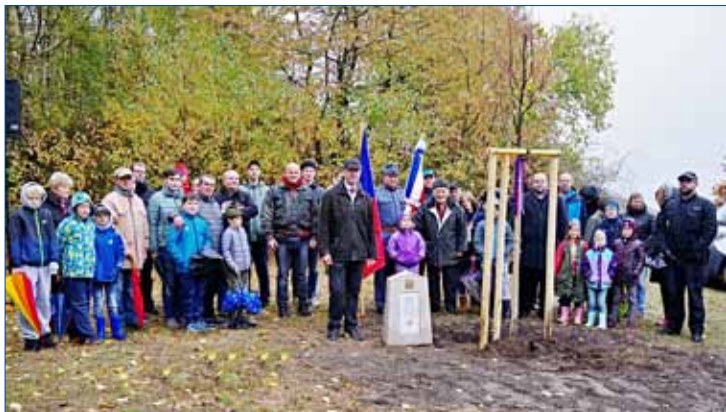
» Společné foto při sázení Stromu svobody v Knížkovicích.