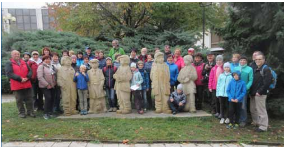
» Bylo nás pět plus 39.

tak trochu připomenutím tohoto významného výročí. Výlet směřoval do hor a ze Zákoutí (část Deštného v Orlických horách) jsme vystoupali na Šerák, kde na hřebeni Orlických hor stojí chata T. G. Masaryka, kterou ve dvacátých letech minulého století zbudoval odbor KČT z Hradce Králové. Jídla restaurace chaty nic neztratila z prvorepublikového