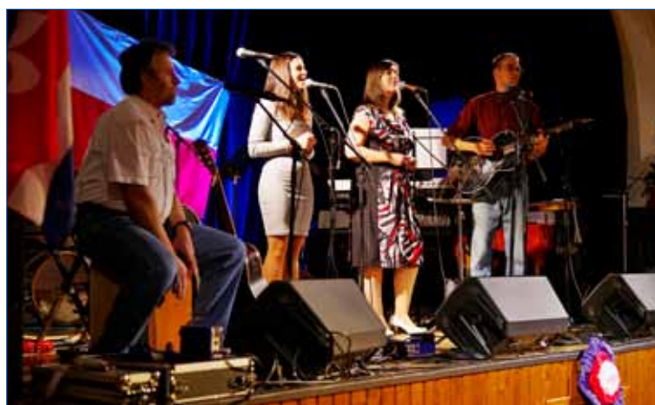
» Hudební skupina POKUS