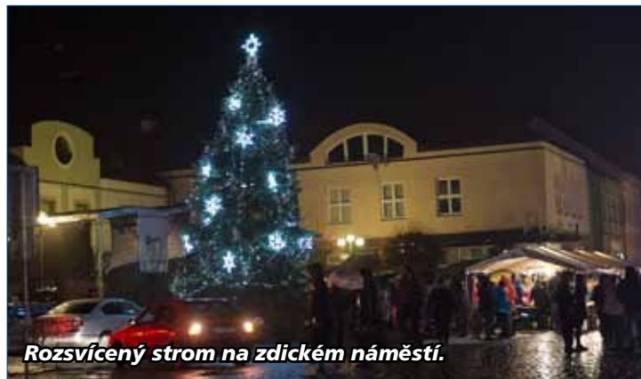
Rozsvícení stromu na zdickém náměstí.