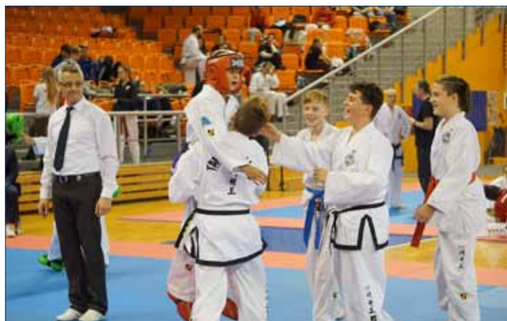
► Tým starších žáků.