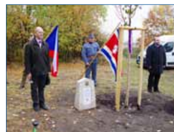
» Slavnost v Knížkovicích zahájila státní hymna.