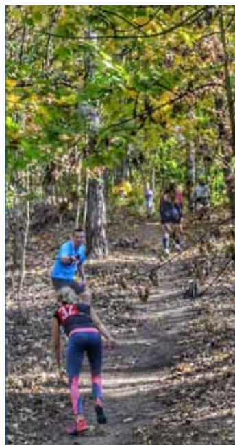
► Povzbuzovalo se, jak to šlo.