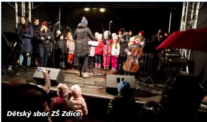
Dětský sbor ZŠ Zdice