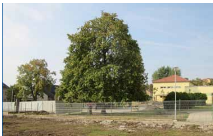
» Lípa zasazená v roce 1968 při 50. výročí vzniku Československa.