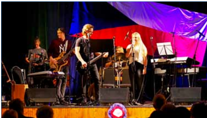
» Bývalá školní kapela