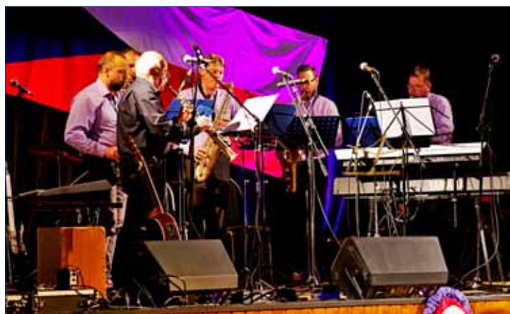
» Šestičlenná saxofonová skupina Saxtet