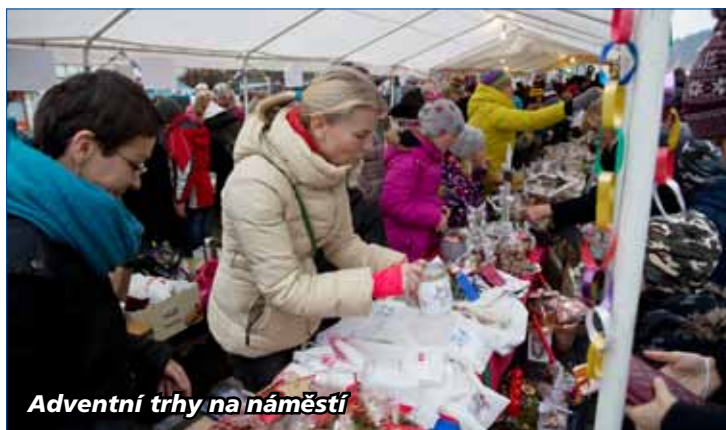
Adventní trhy na náměstí