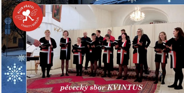
pěvecký sbor KVINTUS

Výzeň z koncertu bude použita na podporu sociálních služeb.