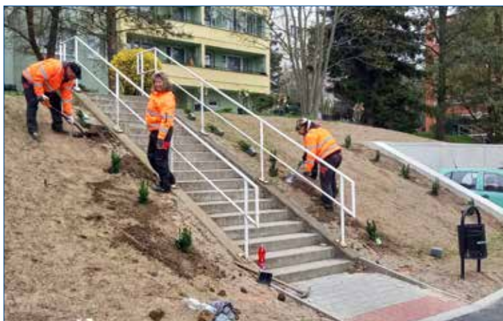
» Pracovníci SaTZM vysazují keře a upravují zeleň na sídlišti ve Velizské ulici.