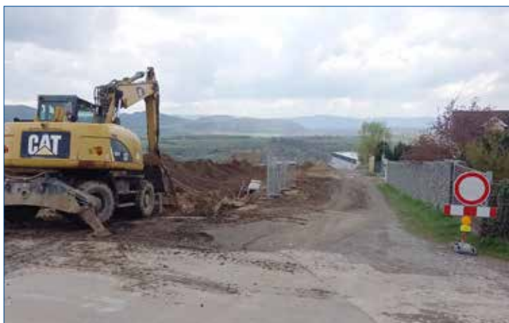
» Budování zbývajících částí komunikace včetně sítí pod Knížkovicemi. Během července by měla být komunikace kompletně dokončena.