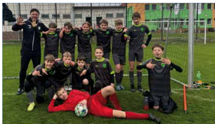
►► Domácí zápas proti Žebráku.