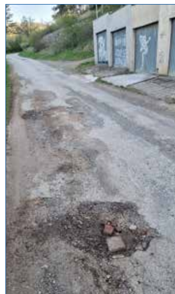
» Stav komunikace v ulici Hroudská ke garážím je ve velice špatném stavu. Firma na opravu je vybrána. Realizace začne koncem května.