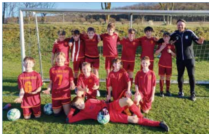
►► Po zápase na Tetině proti Králův Dvůr B.