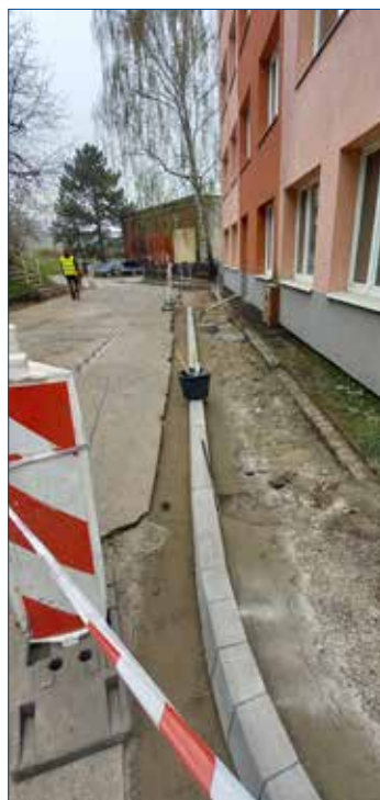
» Oprava komunikace a parkovacích ploch v ulici Velizská nad bývalou kotelnou