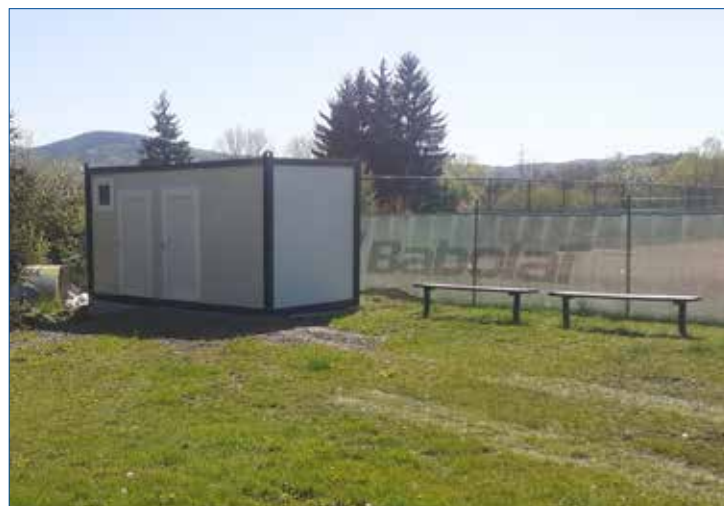
» Umístění nového sociálního kontejneru na tenisových kurtech. Konečně budou mít tenisté odpovídající hygienické zázemí.