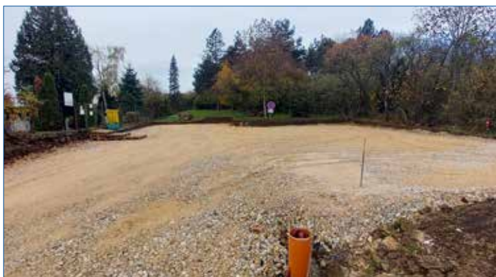
» Výstavba parkoviště u zdického hřbitova