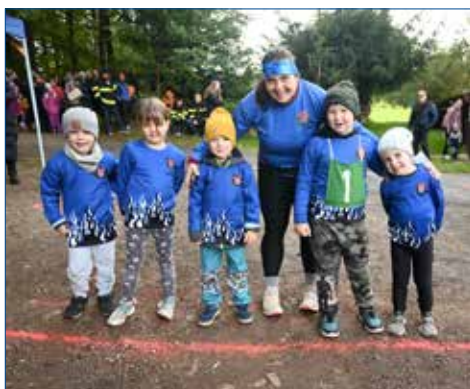
» Přípravka B