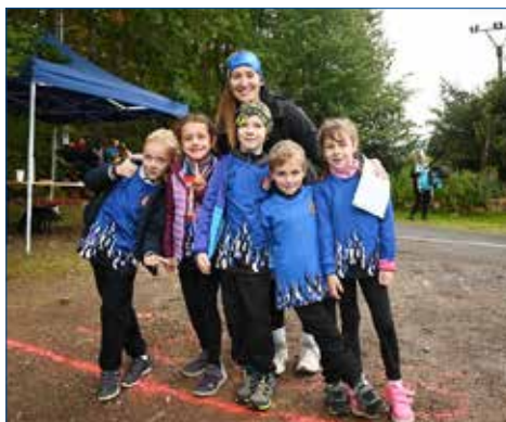
» Mladší žáci C