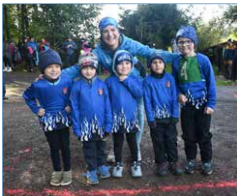
» Přípravka A