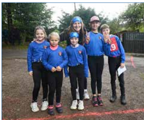
» Mladší žáci A