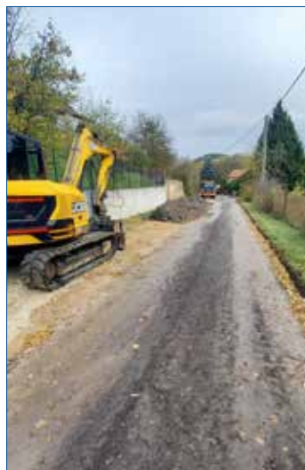
» Oprava komunikace Našich Mučedníků.