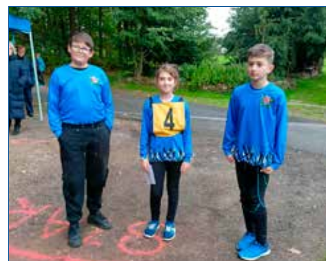
» Starší žáci B

Starším žákům se také dařilo, družstvo A obsadilo 3. místo a tým B, který běžel kvůli onemocněním dvou členů pouze ve třech, obsadil místo 13.