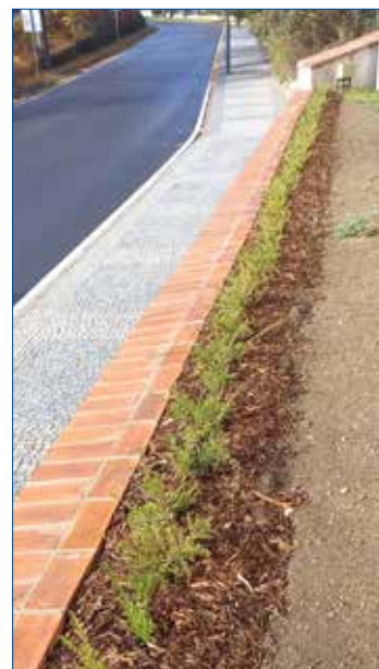
» Osazení nového živého plotu u kostela.