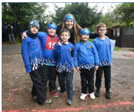
» Mladší žáci D