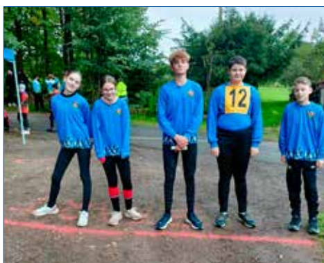
» Starší žáci A

Družstvo A bylo tvořeno staršími dětmi této kategorie, bohužel několik zbytečných chybiček je postavilo na páté místo. Tým B pak obsadil 10. místo, tým C 11. místo a tým D 17. místo.