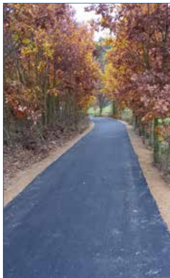
» Knižkovice - oprava cesty ke Kapce.