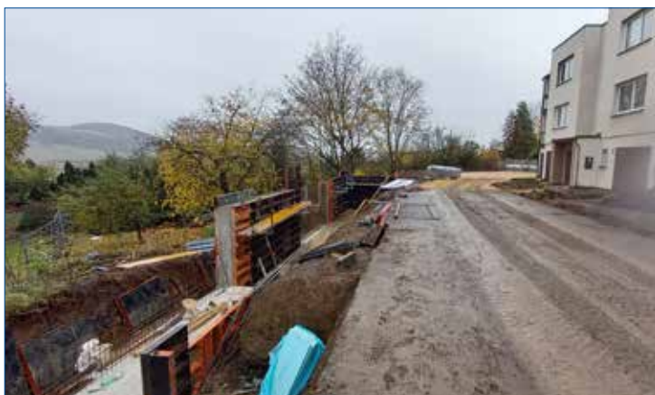
» Z rekonstrukce Velizské ulice.