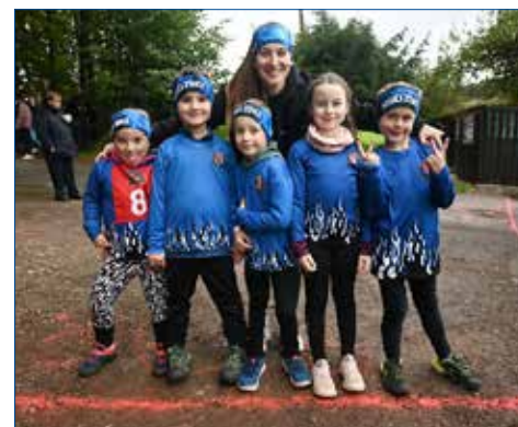
» Mladší žáci B