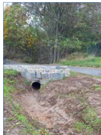
» Knižkovice - čištění vodních průhledů.