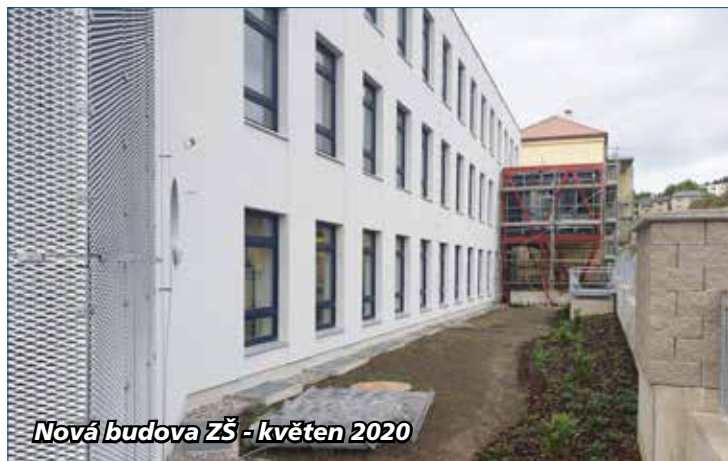
Nová budova ZŠ - květen 2020