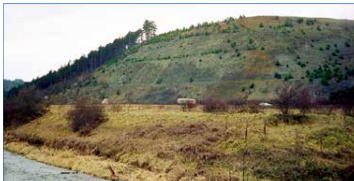
►► Dálniční zářez u Levína na vrchu Lucberk - paleontologická lokalita v královodvorském souvrství. Zima 2000/2001.