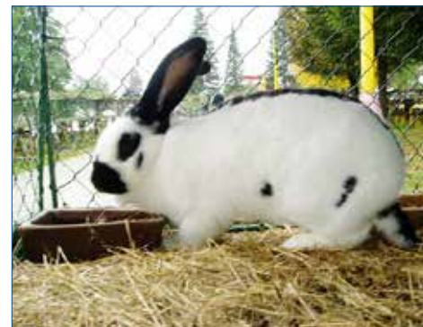
» Německý obrovitý strakáč – snímek z minulých ročníků zdické výstavy.