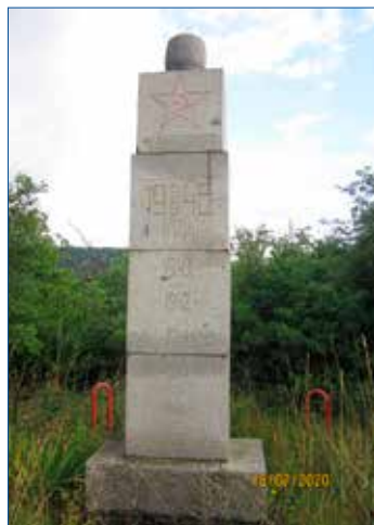
» Památník Rudé armádě v městské části Králova Dvora Levin.

Třetím místem, o kterém řada lidí dodnes neví, je hrob ruského vojáka, příslušníka Ruské osvobozené armády (Vlasovce). Tento hrob se nachází ve Stašově asi 200 metrů