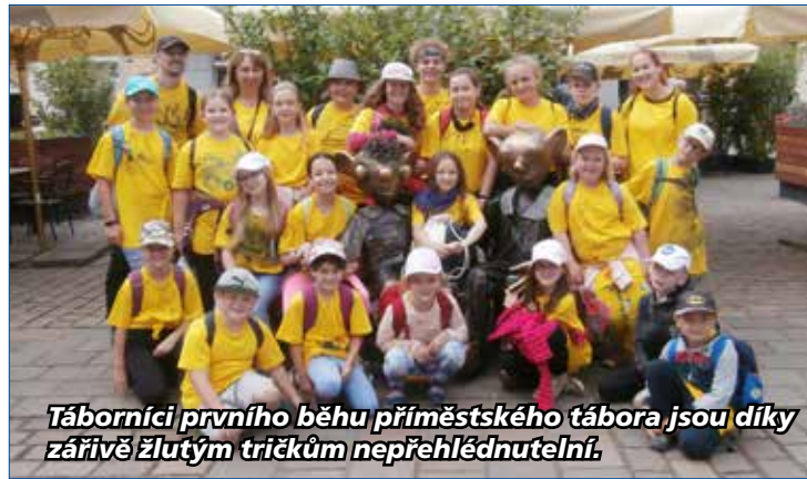
Táborníci prvního běhu příměstského tábora jsou díky zářivě žlutým tričkům nepřehlédnutelní.