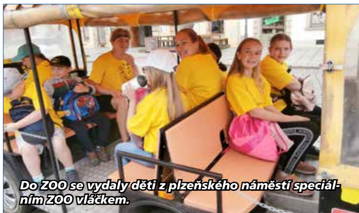
Do ZOO se vydaly děti z plzeňského náměstí speciálním ZOO vláčkem.