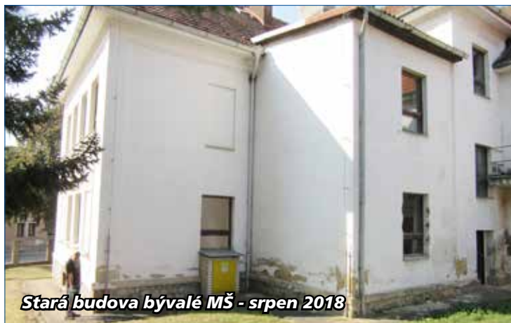
Stará budova bývalé MŠ - srpen 2018