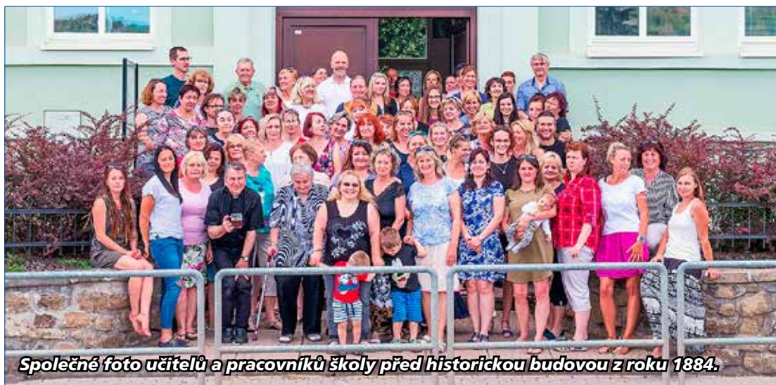
Společné foto učitelů a pracovníků školy před historickou budovou z roku 1884.

Za krásného počasí se akce uskutečnila v úterý 30. června 2020 odpoledne na školním dvoře 2. stupně