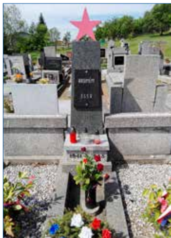
» Dvojhrob sovětských válečných zajatců pochovaných na zdickém hřbitově.