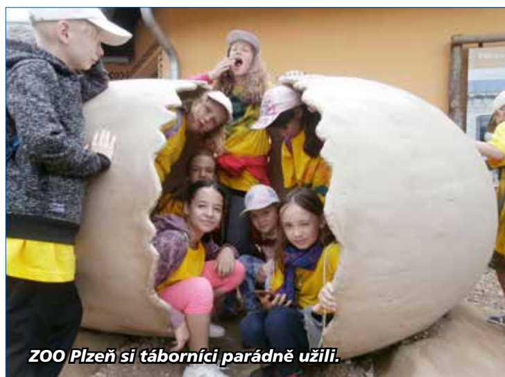
ZOO Plzeň si táborníci parádně užili.