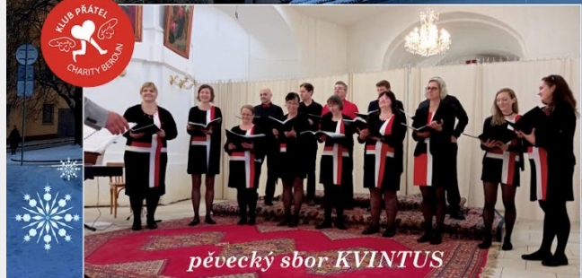
pěvecký sbor KVINTUS