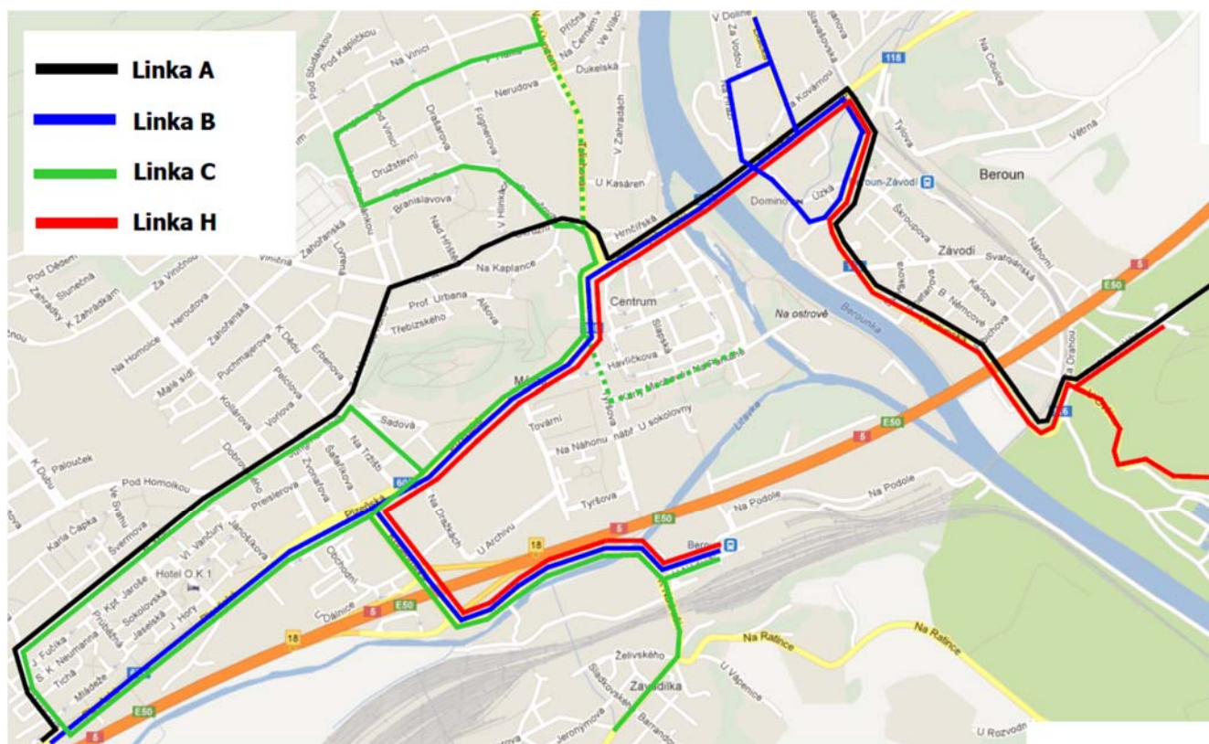
Schéma vedení linek MHD je uvedeno na níže uvedeném schématu. U linky MHD A nedochází ke změnám ve vedení, nově však vybrané spoje v dopoledních hodinách budou zajíždět na zastávku Králův Dvůr, nám. Míru. Linka B bude nově zajíždět na zastávku autobusové nádraží. Vedení linky C se nemění. Linka H pak bude z Hostima nově prodloužena až na zastávku autobusové nádraží.