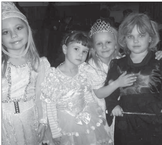
Přehlídka masek na dětském maškarním karnevalu byla velice pestrá.