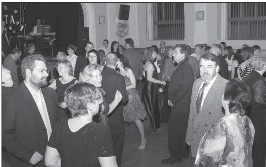
XII. Ples města byl bohatě navštíven.

Od 3. března nastaly některé změny v autobusovém jízdním řádu firmy PROBO TRANS Beroun. Přehled změn najdete uvedený v tomto čísle Zdických novin na str. 10.