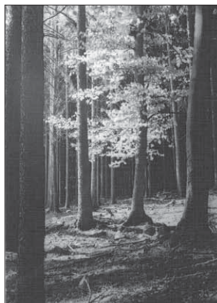
Karel Slánský: Na Plešivci