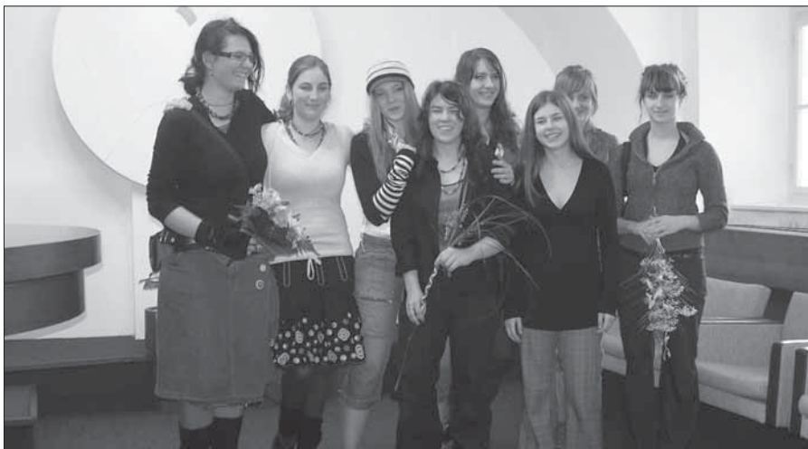
Studentky pražské „Hollarky“, které představují svoje výtvarné práce ve výstavní síni zdičské radnice.

Výstava je ve všedních dnech otevřena v pracovní době MěÚ, v sobotu a v neděli od 14 do 17 hodin. Sm