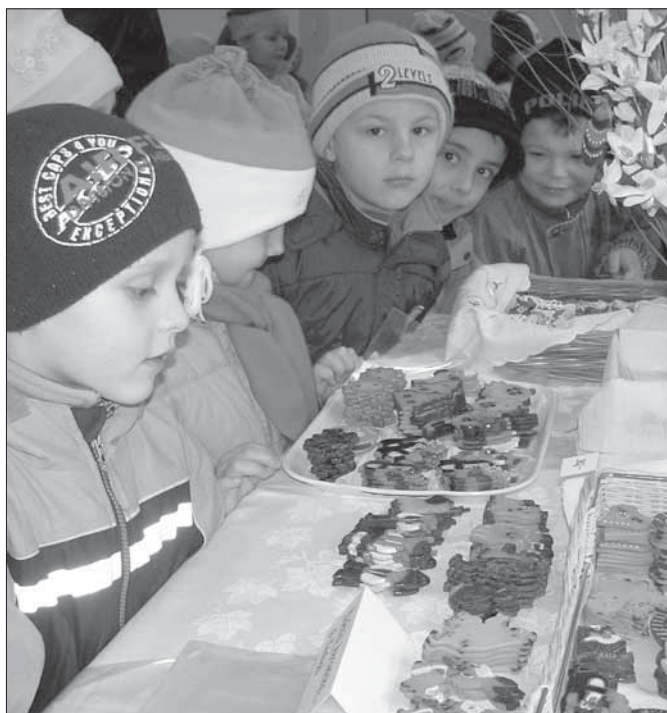
Děti z MŠ si na výstavě prohlížejí keramické figurky pí Kaslové.