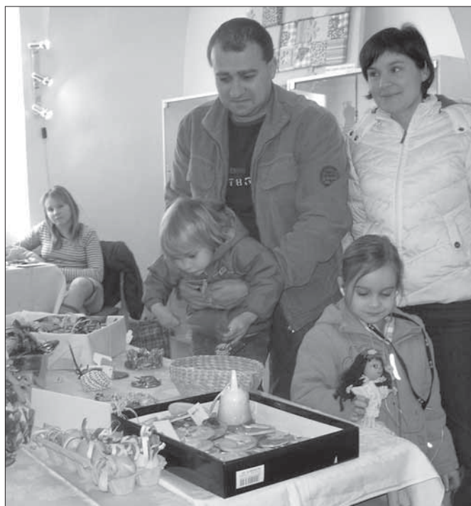
O víkendu zavítaly na výstavu celé rodiny.

Děkují všem, kteří ochotně spolupracovali při realizaci výstavy. Bez jejich spolupráce by tradiční velikonoční výstava, stejně jako