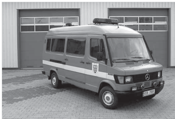
Z mikrobusu, který byl vyřazen z vozidel Policie ČR, vzniklo díky šikovným rukám členů SDH Zdice parádní vozidlo.