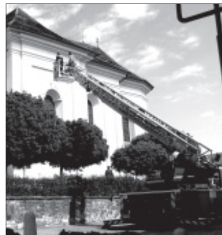
Nahrazení ukradených okapů novými provedla za pomoci techniky berounských hasičů na zdickém kostele 14. května firma KOVO F. Johana. Uvědomují si pachatelé březnové krádeže, že musely být zbytečně vynaloženy finanční prostředky?

Plánovaná rekonstrukce místních komunikací se bude odvíjet právě od dokončeného projektu, který řeší kanalizaci ve Zdicích. Tím chci říci, že nebudeme momentálně rekonstruovat ty komunikace, se kterými se počítá v projektu pro kanalizaci, neboť by to bylo plýtvání finančními prostředky. Mezi takové ulice patří např. Stará zvonice, část ulice Na Vyhliďce, Havlíčkova ulice, kde se počítá navíc i s rekonstrukcí plynového řadu a další. V letošním roce byla opatřena asfaltem komunikace v Knížkovicích s náklady okolo 200 tisíc Kč. Dále proběhne koncem května vyasfaltování části ulice Na Vyhliďce, kde byla vybudována tlaková kanalizace. V červnu by měly probíhat práce na úpravě prostoru před vlakovým nádražím a během léta práce spojené s vybudováním chodníku ve Vorlově ulice. Ve druhé polovině roku se počítá s novým chodníkem na kraji Černína. Při realizaci těchto prací hledá vedení města ve spolupráci s firmou STRABAG, která dílo realizuje, úsporná opatření, která by se dala využít k dalším uvažovaným opravám tak, aby bylo naše město hezčí a pro chodce i řidiče bezpečnější – např. vybudováním odstavného pruhu v Komenského ulici nebo úpravou křižovatky u Zimů nebo přeložením