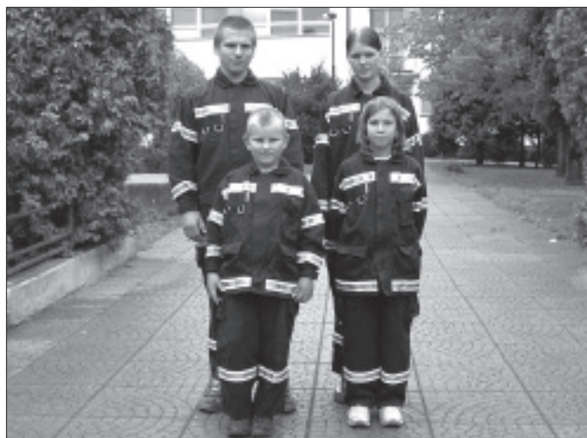
Čestnou stráž u pomníku obětí světových válek stáli mladí členové zdického

Město vyzvalo pět firem na zpracování projektu pro ÚR na výstavbu MŠ a ZŠ v rámci akce integrace školských zařízení. (Dokončení na str. 3.)