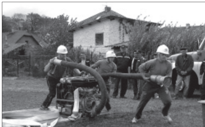
Družstvo SDH při požárním útoku.