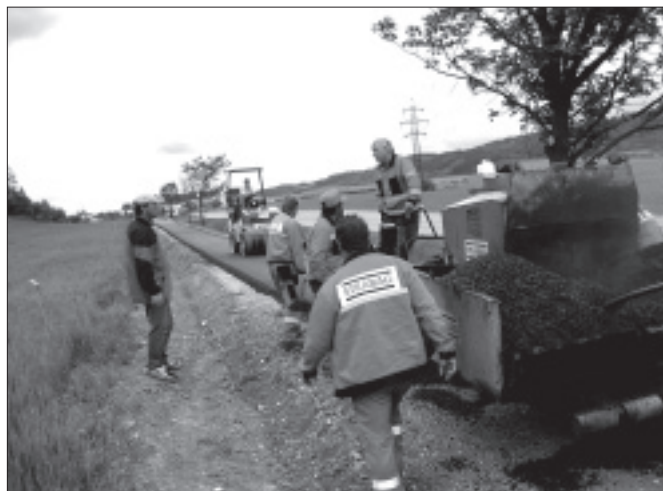
Budování nového chodníku ke Kostalu provedla firma Strabag.