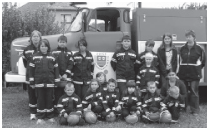
Na dospělé soutěžící v požárním sportu se přišli podívat nejmladší členové SDH Zdice.

Sdružení hasičů Čech, Moravy a Slezska, okresek Zdice, pořádalo v sobotu 12. května od 9 hodin okreskovou soutěž v požárním sportu o putovní pohár věnovaný starostou města. Devět družstev, z nichž jedno bylo družstvo žen z Černína, soutěžilo v prostoru Farčiny nejdříve v požárních štafetách (4 x 50m) a potom v požárním útoku. Soutěžícím tentokrát nepřálo počasí. Zápolení družstev muselo být při požárních útocích dokonce přerušeno kvůli velkému lijáku. Po jeho skončení se družstva Svaté a Zdice III. dohodla, že soutěž dokončí, a to i přesto, že vzhledem k nepříznivým podmínkám nebudou moci dosáhnout dobrých časů a získat tak celkově lepší umístění.