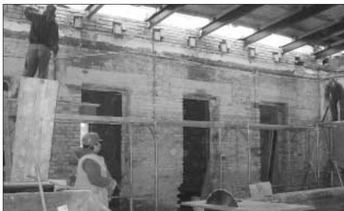
Rekonstrukce společenského domu pokračuje - na snímku výměna střechy nad stávajícím přísálím.