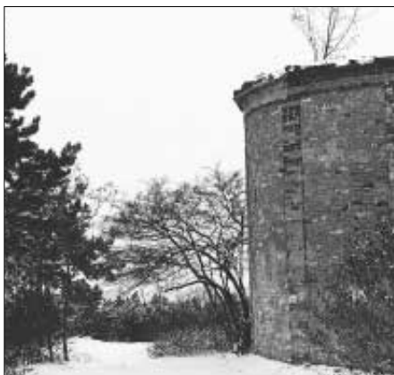
Dnešní pohled na torzo kaple na Koukolově hoře.

Z dochovaných obrazů a pohledů na Koukolovu horu (470 m n.m.) z konce 19. století je zřejmé, že její vrchol byl skalnatý a zcela holý. Obdobně tomu bylo v té době i u okolních kopců. Jen na jejím vrcholu od roku 1832 stála kaple, zasvěcená svatému Blažejovi. V té době podle písemných pramenů skončila na vrchu