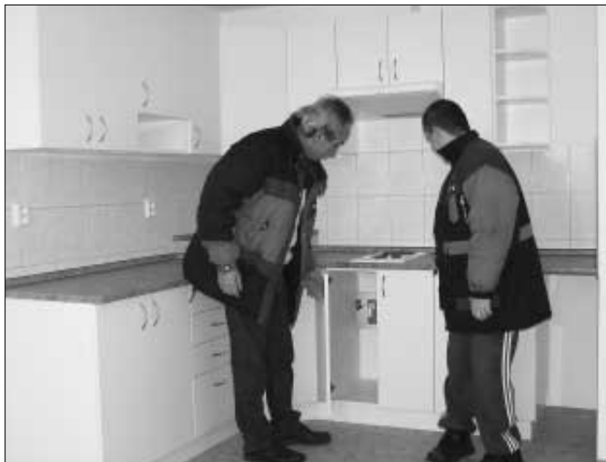
Pohled do kuchyně nových bytů v Černíně čp. 1.

V lednu byla prováděna přeložka kabelu nízkého napětí v ulicích Husova a Žižkova. Nejedná se o investici Města Zdice, ale investorem je ČEZ