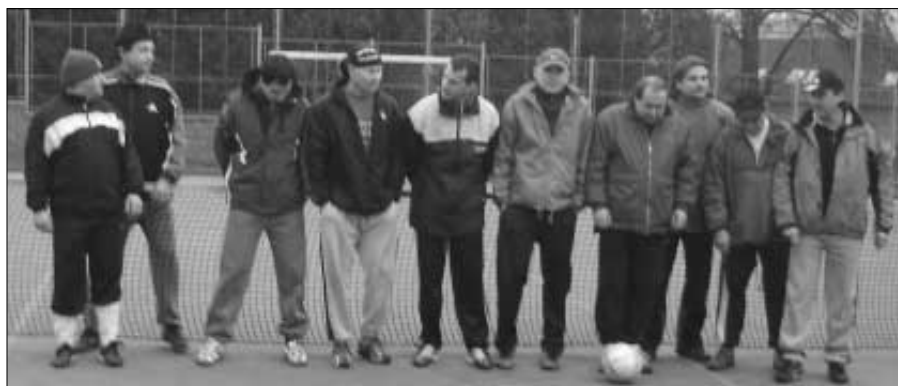
Účastníci nultého ročníku vánočního turnaje v nohejbalu, který pořádala sportovní komise města 25. prosince 2006 na hřišti u ZŠ v Žižkově ulici. Informace přinesly minulý ZN.

Rohličky - 1,60 • Nový kořenový chléb Másl - 19,90 • Jihočeské mléko - 12,90 Želetavská eidam cihla - 99,90 Perníky - 3,90 • Tatranky - 3,90 Horalky - 3,90 • 4 druhy těstovin - 7,90 Pivo Staropramen - 8,50 • Pivo Měšťan - 4,90 Uzeniny za Super ceny: Paprik. klobása - 39,90 • Jemné párky - 39,90 Kabanos - 49,90 • Labužnické párky - 49,90 Kuřecí šunka - 119,90 • Vynikající šunka - 89,90 Junior - 39,90 • Malá vysočina - 39,90 Kladenská pečeně - 149,90 Debrecínská pečeně - 149,90 Novinky výborné kvality: Cikánský kotlet • Zauzená krutí prsa Šunkový kabanos • Čabajkový kabanos Šunka pro děti • Párky s nivou • Jitrnice Aspiková podkova • Uzený bok speciál Eso párky od Makovce Vynikající vínná klobása - út a čt Dále nabízíme: Káva - 4,90 • Káva Paloma 250 g - 24,90 Vepřová konzerva - 19,90 nejlevnější krmivo pro psy a kočky