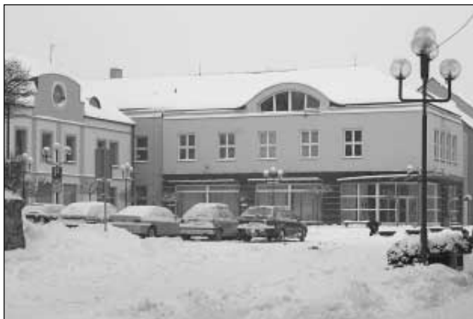
Sněhová nadílka - 24. 1. 2007.

Podle Hydrometeorologického ústavu v Praze byla první polovina ledna nejteplejší za 225 let. Josef Hůrka