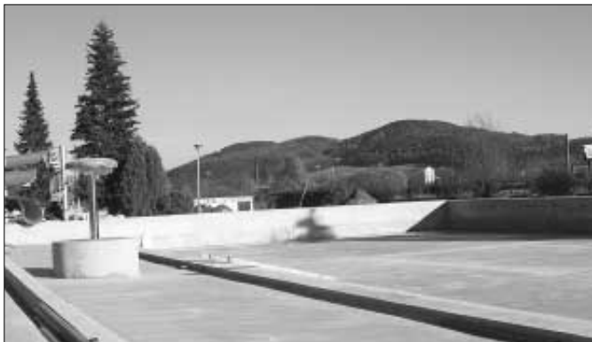
První etapa rekonstrukce koupaliště se chýlí ke konci. Firma GHC Invest, s. r. o., Praha dokončila náročné betonování celého bazénu. V listopadu probíhaly práce na zpevněných plochách okolo bazénu, dokončovala se stavba objektu nové technologie úpravy vody a nových sociálních zařízení.