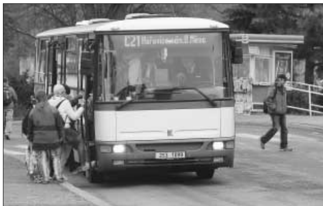
Autobusovou dopravu bude zajišťovat pro Zdice firma PROBO TRANS.

Pro informaci cituji z odpovědi ministra dopravy: "I přes rozšíření nabídky počtu spojů na trati Praha - Plzeň v roce 2004 je počet cestujících využívajících rychlíky ze Zdic dlouhodobě velice nízký, a to i ve srovnání s ostatními místy zastavení rychlíků na lince Praha - Plzeň. Podle údajů dopravce České dráhy v období mimo přepravní špičku zpravidla počet nastupujících cestujících nedosahuje ani 5 osob u jednoho vlaku. Pro Vaši informaci, počet cestujících využívajících železnici pro cesty do Prahy či Plzně je ve srovnání s nejdalekými Hořovicemi přibližně šestinový a je dokonce nižší než ve Zbirohu a srovnatelný se zastávkami Mýto či Holoubkov, kde rychlíky rovněž nestaví. Většina cestujících ze železniční stanice Zdice navíc využívá vlak pro cesty do blízkých Hořovic nebo Berouna, a tyto přepravní vztahy jsou podle názoru Ministerstva dopravy dostatečně zabezpečeny regionální dopravou. Tento stav, kdy je železniční doprava občanů města Zdice využívána relativně méně než v okolních sídlech, je patrně způsoben poměrně značnou odlehlostí železniční stanice od vlastního města Zdice a značnou nabídkou alternativní lin-