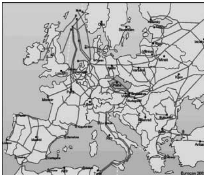
Hlavní evropské plynovody.

Další důležitá ložiska zemního plynu v Evropě se nachází v Severním moři. Tady intenzivní těžba začala v šedesátých letech