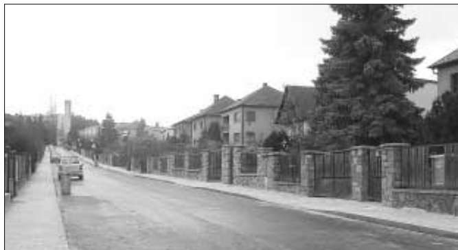
Provedením asfaltové vrstvy komunikace, pokládkou zámkových chodníků a osazením dopravních značek byla dokončena velice náročná několikaměsíční rekonstrukce Erbenovy ulice.