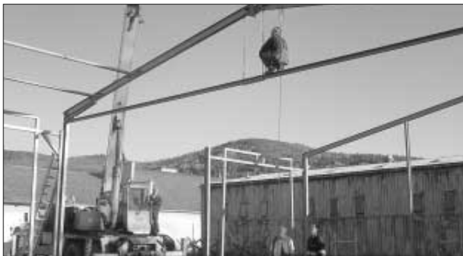
V rámci rekonstrukce hasičské zbrojnice probíhala v listopadu vlastní výstavba haly pro zásahová vozidla. Na snímku pracovníci firmy Spektra, s.r.o., Beroun při montáži ocelové konstrukce haly.