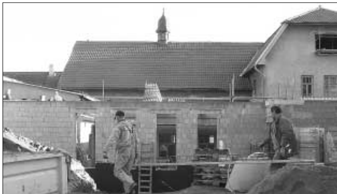
V rámci rekonstrukce společenského domu provádí firma Spektra, s.r.o., Beroun přístavbu předsálí, které bude sloužit jako galerie či přednášková místnost. Současně pokračují práce na vnitřních stavebních úpravách společenského domu.