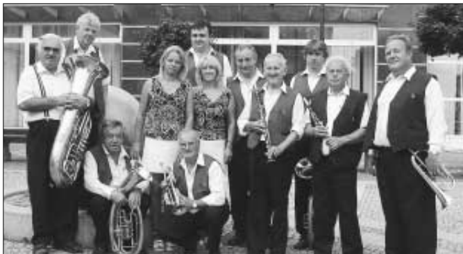
Také letos bylo možné zavítat na pěší zónu na letní nedělní koncerty, které pořádá Společenský klub Zdice. 30. července potěšila milovnický dechovky kapela Cheznovanka.