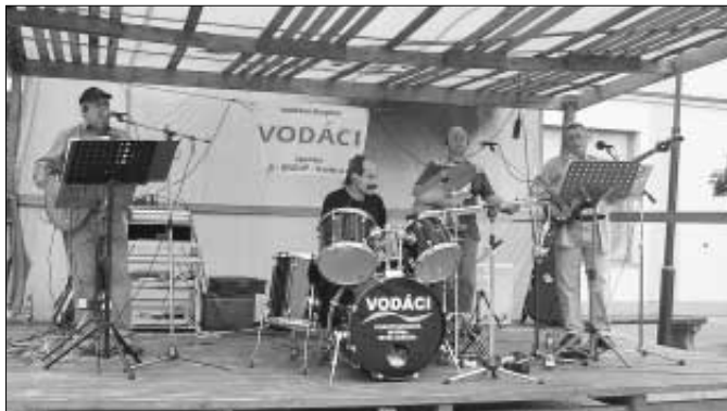
V neděli 20. srpna se představila návštěvníkům koncertu country kapela Vodáci.