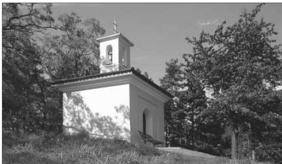
Nově opravená kaplička v Černíně září do daleka. Snímek bude součástí chystaného kalendáře Zdice 2007.