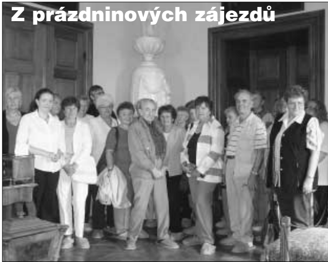
Kulturní komise a Společenský klub Zdice připravily na 22. 7. zájezd do středověkého městečka v Ostré u Lysé nad Labem. Účastníci zájezdu se seznámili s ukázkami různých řemesel, mezi kterými bylo např. košíkářství. Součástí tohoto zájezdu byla i prohlídka bylinných zahrad a návštěva soukromého muzea kamen. 18. srpna se uskutečnil zájezd do nově otevřeného zámku v Mníšku pod Brdy. Návštěvy všech uvedených míst můžeme vřele doporučit.