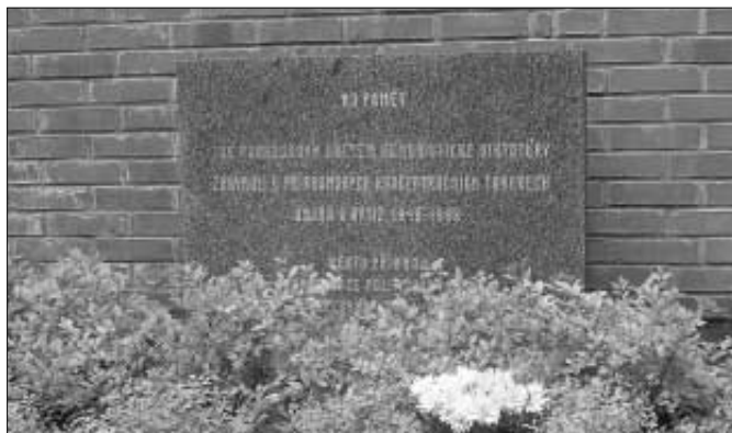
Na pomníku, který vybudovalo na příbramském hřbitově Město Příbram a Konfederace politických vězňů Československa, je napsáno: Na paměť zde pochovaným politickým obětem komunistické diktatury. Zahynuly v příbramských táborech Vojna a Bytíz 1948 - 1968.

K tomuto zdánlivě ironickému přirovnání je třeba dodat následující vážné skutečnosti. Vytěžené přírodní bohatství s ohledem na mezinárodní politickou