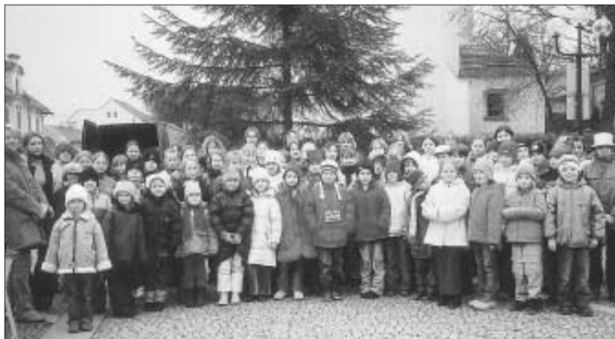
Pěvecký sbor Skřivánek ZŠ Zdice při dopolední zkoušce na večerní účinkování na setkání u vánočního stromu.

Tradiční vánoční výstavu bylo možné navštívit od 7. do 12. prosince 2004 ve výstavní síni radnice. Byla bohatě navštívena. Milá byla návštěva obyvatel z domova důchodců, které přivezli autem, někteří absolvovali cestu za pomoci sester na pojižděném vozíku. Mile působily i děti z obou MŠ, které si na výstavě s chutí zazpívaly několik koled.