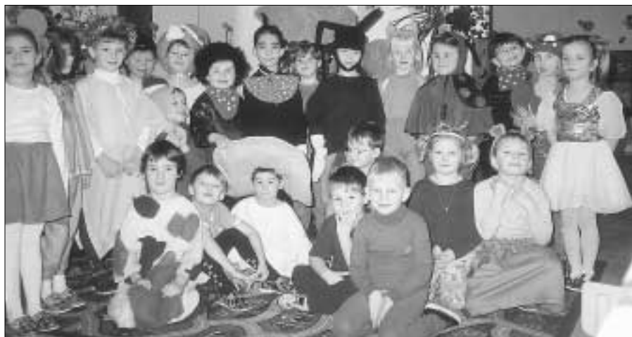
Prosinec byl časem vánočních besídek v obou zdických MŠ. Na horním snímku malí herci z MŠ v Zahradní ulici, kteří se pochlubili pohádkou "Jak hříbek rosti". Na druhém snímku pohled na rodiče v MŠ v Žižkově ulici při sledování účinkování svých ratolestí při besídce.