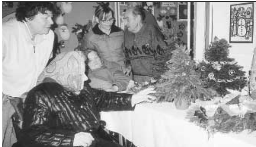
Na vánoční výstavu zavítali v doprovodu sociálních pracovníků také obyvatelé domova důchodců.

Dojednává se schůzka se starostou Králova Dvora ohledně získání informací o možnostech financování vybudování protipovodňových opatření v úseku Červeného potoku od mostu (dřive u Macourkova zahradnictví) směrem k čističce odpadních vod. Vybudování protipovodňových opatření