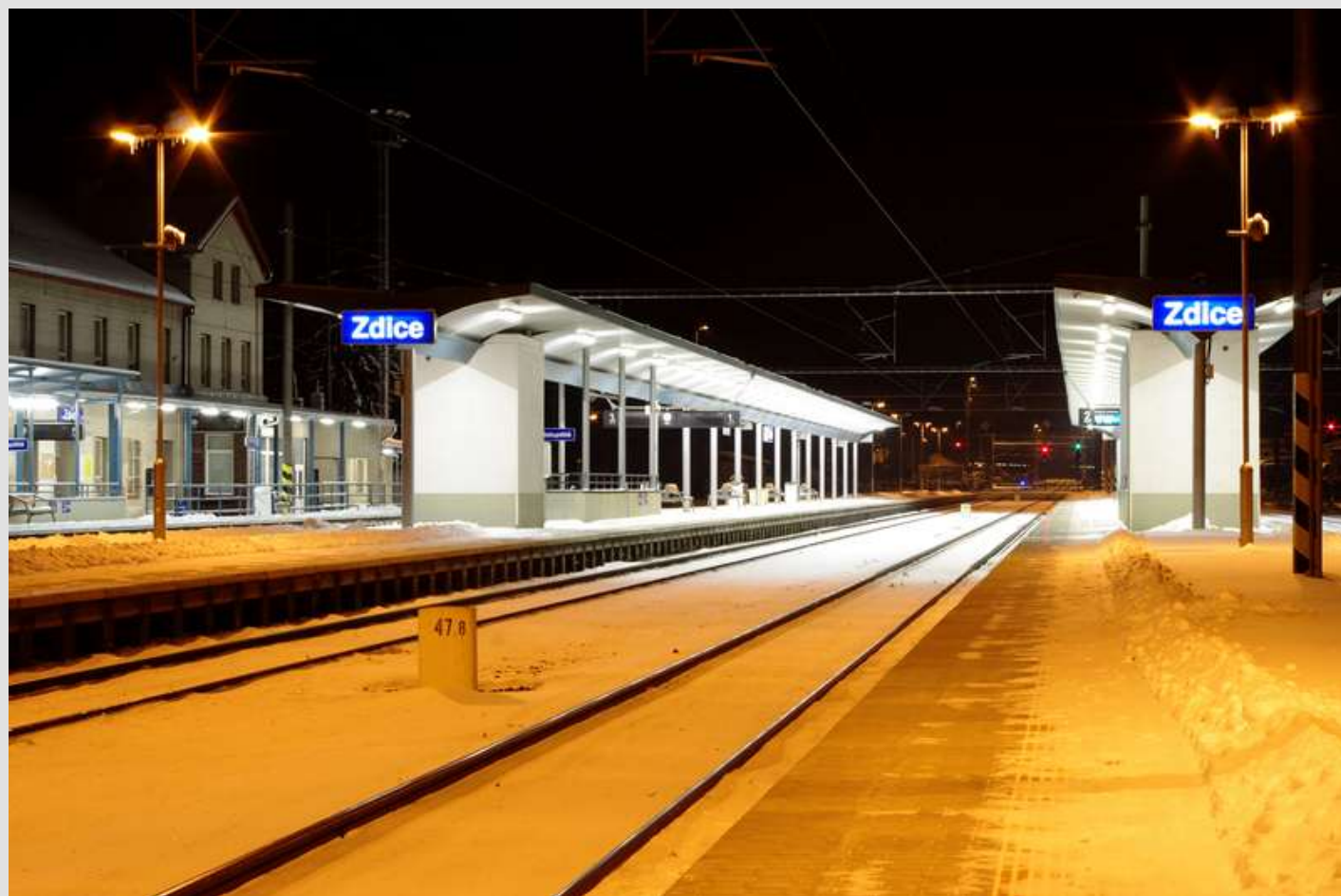
Zdické vlakové nádraží