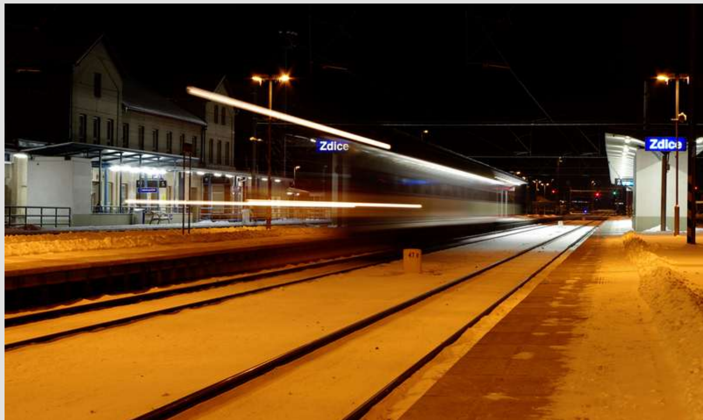
Zdické vlakové nádraží Autor J. Bárta