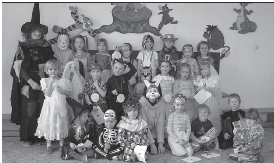
Ve středu 20. února ovládlo karnevalové veselí celou MŠ v Zahradní ulici. Přehlídka nádherných masek byla opravdu pestrá.