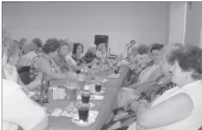
Výborná nálada vládla na „Příjemném posezení s hudbou“ konaném 13. června v pěkně zrekonstruovaném společenském domě.

Spokojení návštěvníci vyslovili názor, že podobná setkání by se měla konat častěji s tím, že úměrné vstupné by přispělo k úhradě kulturního vystoupení a občerstvení by si hradil každý sám. Vcelku podnětný námět pro jednání kulturní komise RM. Josef Hůrka