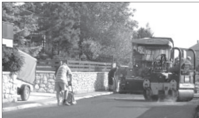
V květnu se dočkala pěkného vzhledu další zdicí komunikace. Tentokrát firma Strabag opravovala ulici Na Vyhliďce.