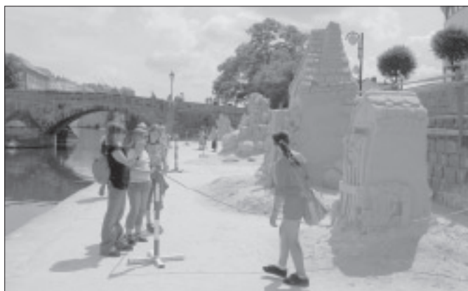
Fotografický pozdrav ze školy v přírodě zaslala do redakce třída 5. A. V průběhu týdne stačili žáci zajet i do Písku, kde je zaujaly krásně zpracované pískové sochy.