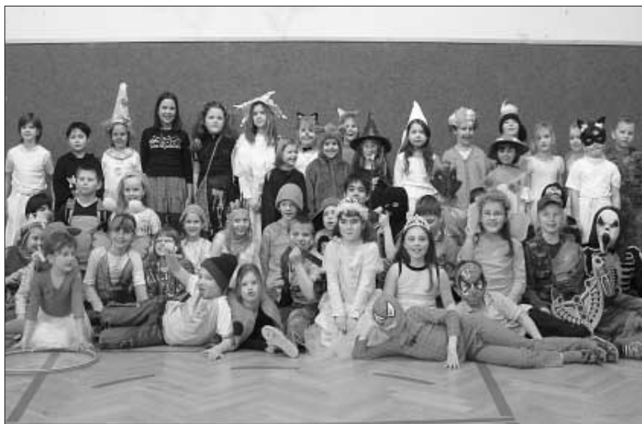
Masopust oslavily děti ve školní družině ZŠ ve středu 21. února velmi pestrá přehlídkou masek.