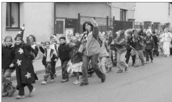
1. 6. oslavily děti ZŠ svůj svátek tradičním průvodem masek městem. Na koupališti a ve sportovní hale byl pro ně připraven bohatý program.

Plán na měsíc červen byl také plný školních výletů. Třída 1.A si zajela vlakem do Srbska, kde děti strávily příjemné chvíle v jednom z nejhezčích míst našeho