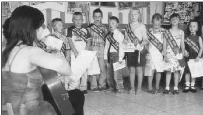
Slavnostní rozloučení s mateřskou školou.