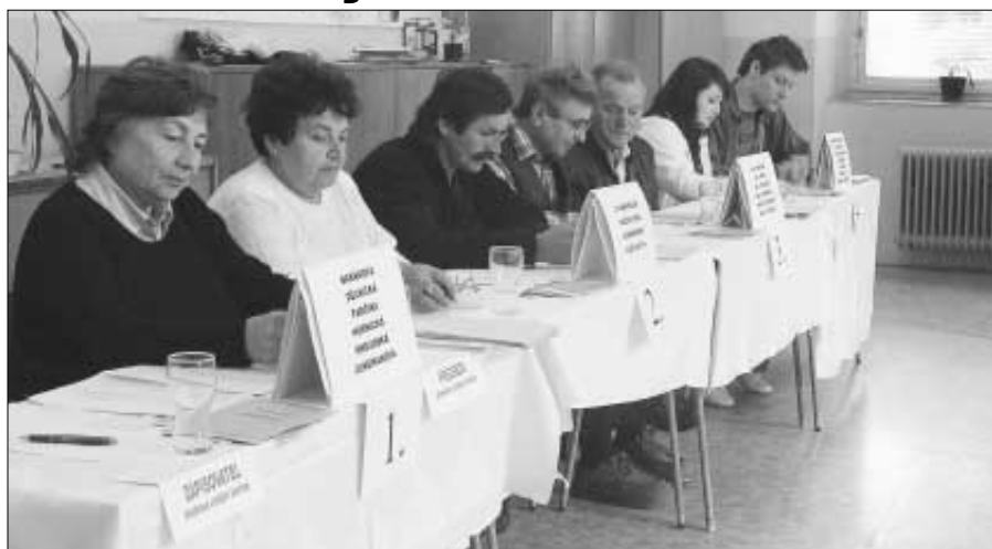
V každém volebním okrsku pracovala v průběhu voleb okrsková volební komise. Na snímku volební komise okrsku č. 1 v ZŠ v Komenského ulici.

Voleb do Poslanecké sněmovny Parlamentu ČR, které se konaly 2. a 3. června 2006, se zúčastnilo ve Zdicích 67,23 % voličů. Volilo se celkem v pěti volebních okrscích - tři byly ve Zdicích, jeden v Knížkovicích a jeden v Černíně.