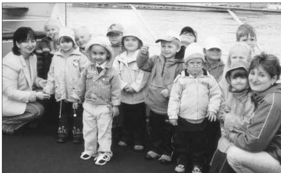
Výlet se dětem moc líbil.