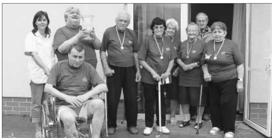
Zdicití seniori se na sportovní hry dobře připravili. Do soutěže se zapojilo družstvo mužů a družstvo žen, které celou soutěž vyhrálo. Gratulujeme!