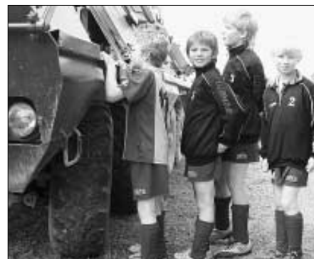
O prohlídce vojenské techniky, kterou připravil KVHV Zdice, měli páni kluci veliký zájem.