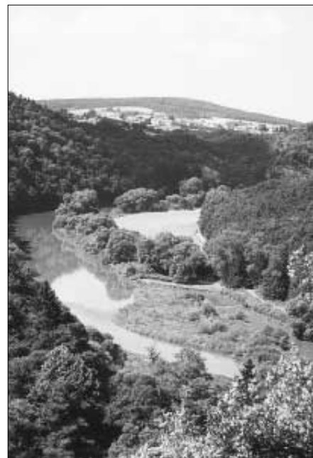
Pohled z Týřova na řeku Berounku, na levé straně vrch Vosmík s opuštěnými lomy.