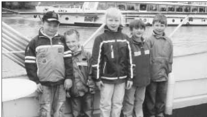
Výlet dětí MŠ Zahradní na lodi Moravia po Vltavě.

Tak jako v minulých letech, tak i letos se děti všech věkových kategorií účastnily výtvarných soutěží, a že si nevedly špatně, ukazuje umístění na předních místech.