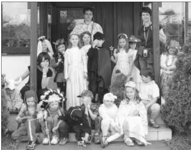
Đeti MŠ Žižkova měly na karnevalu krásný zážitek z nádherných masek.