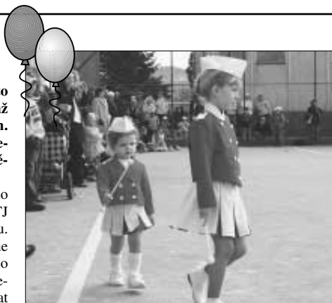
V programu Dne dětí vystoupily tradičně zdičké mažoretky.