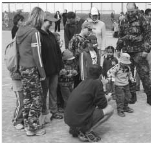
U všech soutěží bylo stále plno.