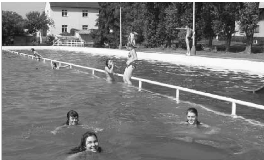
Koupaliště je letos otevřeno od soboty 24. června. Teď už si lze jen přát hodně slunečných dnů, jako tomu bylo v závěru měsíce června.

1. etapa výstavby by měla stát 12 miliónů korun, které město obdrželo z prostředků veřejné pokladní správy, a řeší celkovou rekonstrukci a rozšíření Společenského domu. V rámci rekonstrukce a modernizace jeho současných prostor budou především zvýšeny kapacity nevyhovujících hygienických zařízení a zřízeno WC pro invalidy, dále bude zřízeno hygienické zařízení pro účinkující a obsluhu občerstvení. U vyrovnávacího schodiště hned u hlavního vstupu do Společenského domu bude zřízena sklápěcí ocelová plošina pro invalidní návštěvníky, kterým tak bude umožněn bezbariérový přístup do Společenského domu. Přístavbou Společenského domu směrem do dvora vzniknou zcela nové prostory