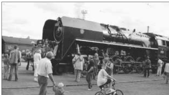
Nablýskaná parní lokomotiva vyjela v sobotu 20. května u příležitosti výročí trati Zdice - Protivín. Pro zájemce o historickou techniku byla připravena jízda z Berouna až do Březnice.

U příležitosti 61. výročí osvobození Československa od německého fa-