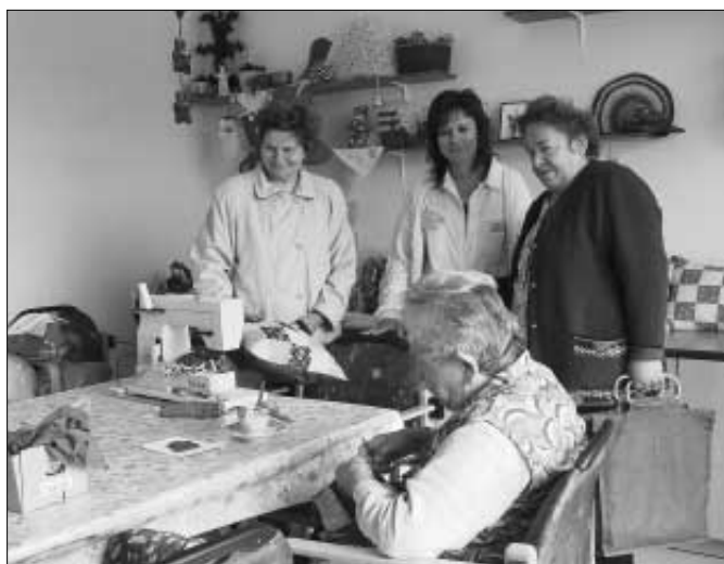
Při Dnu otevřených dveří bylo možné si prohlédnout celý areál DD. Snímek je z místnosti pracovní terapie.