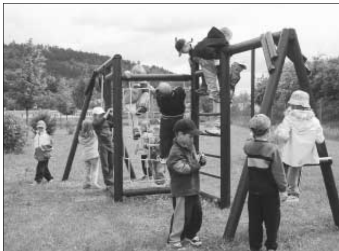
Děti zdicích MŠ při slavnostním otevření nového hřiště vyzkoušely s radostí všechna jeho nápaditá zařízení.