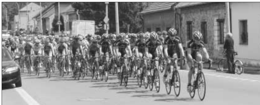
V sobotu 13. 5. byl odstartován již 58. ročník cyklistického etapového závodu míru. Zdicemi projížděli závodníci v pondělí 15. 5. v průběhu 3. etapy, která vedla z Berouna do Karlových Varů. Na snímku peloton při průjezdu Husovou ulicí.