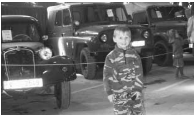
V areálu bývalých kasáren se uskutečnila 20. a 21. května velká výstava vojenské historické techniky. Výstavu pořádal KVHV Zdice.

Dny 21. a 22. května letošního roku znamenaly pro život našeho města určitý předěl. Zdice by se měly stát zajímavější a vyhledávanější. U příležitosti 130. výročí uvedení do provozu železniční tratě Rakovník - Beroun - Zdice - Příbram - Písek - Protivín bylo otevřeno v bývalých prostorách železničního depa skromné muzeum věnované silniční a železniční dopravě.