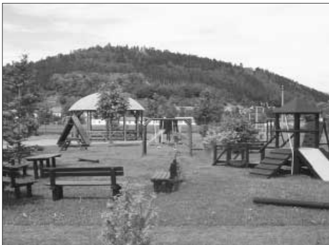
Pohled na nově vybudované dětské hřiště ve velké zahradě DD. Děti se mohou opravdu těšit na jeho pěkné vybavení.