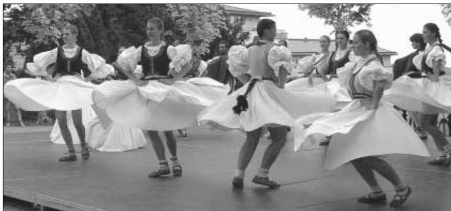
Účastníci zájezdu do Národopisného muzea v Praze si v neděli 21. května prohlédli nejen jeho bohaté sbírky, ale viděli i krásný folklórní program, který předvedly v areálu muzea taneční soubory z Čech a Moravy. K pohodové atmosféře přispělo i pěkné slunečné počasí.

Kulturní léto pořádá Společenský klub Zdice a Kulturní komise. Informace: SD Zdice, tel.: 311 685 186, spolklub.zd@iol.cz, www.mesto-zdice.cz