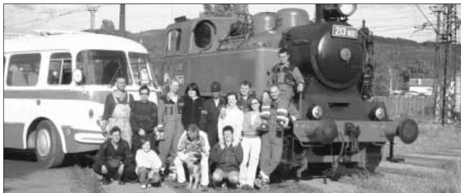
U příležitosti 130. výročí trati Zdice - Protivín bylo ve Zdicích v areálu bývalého depa ČD otevřeno muzeum železniční a silniční techniky. Na snímku skupina nadšenců historické techniky SAXI, kteří jeho vybudování věnují spoustu volného času.

V létě proběhne celková oprava kapličky v Černíně. Opravu provede místní firma Pavel Mayer - Tesařství za cenu 136 000,- Kč.