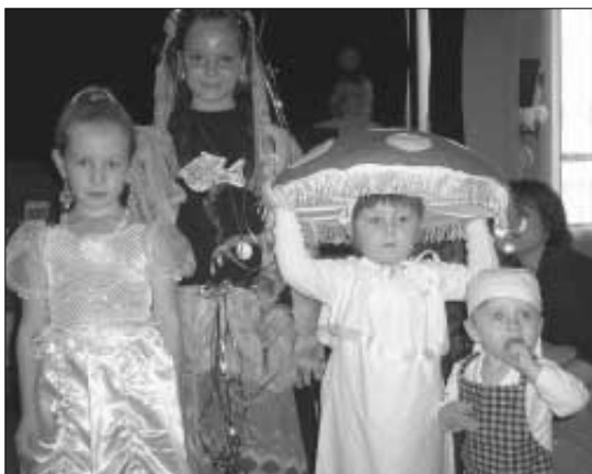
Na Dětském maskárním karnevalu, který pořádá 12. 3. Společenský klub Zdice, se šelý nádherné masky.