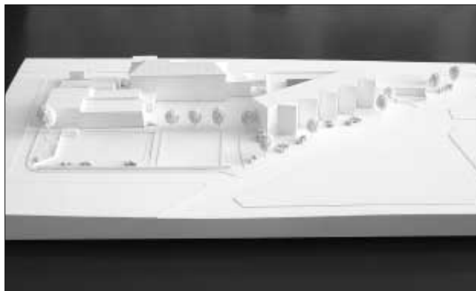
Na snímku model objektu ZŠ v Žižkově ulici včetně přístavby budovy 2. stupně ZŠ. Návrh: Ing. arch. Tomáš Šantavý.

V areálu bývalých kasáren ve Zdicích byla již zahájena oprava střechy objektu skladové haly. Jako dodavatel byla vybrána firma Izolace Sing, s.r.o., Karlštejn 225. Termín dokončení opravy je konec dubna 2006.