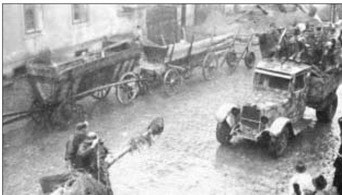
Průjezd Vlasovovy armády Berounem 5. 5. 1945.

Dějiny II. světové války znají mnoho generálů, ať stáli na straně Spojenců, či v řadách hitlerovské fašistické armády. Snad nejrozporupnější osobností se stal generál Rudé armády Andrej Andrejevič Vlasov, který se zapsal i do českých dějin aktivní účastí svých vojsk v povstání pražského lidu proti fašistickým okupantům v květnu roku 1945.