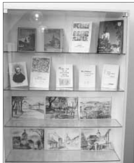
Na výstavě si bylo možné prohlédnout i upomínkové předměty Zdice.

Na dny 12. - 22. března připravil pan Pavel Dušánek do výstavní síně zdické radnice obsáhlou výstavu dokumentů, které podrobněji seznamovaly veřejnost s životními osudy 42 osobností uveřejněných v jeho publikaci "Zdice - Rodáci a občané". K prohlížení byla celá řada zajímavých dokumentů, které získal při přípravě publikace, a které pro jejich rozsáhlost nebylo možné v publikaci uveřejnit.