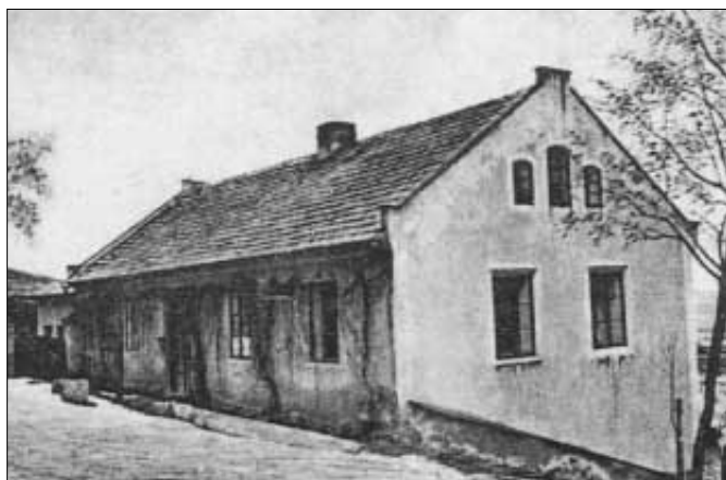
Budova školy byla vystavěna v roce 1873 a 7. října téhož roku byla slavnostně vysvěcena.