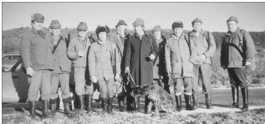
Členové mysliveckého sdružení "Hrouda Zdice".

Kladně hodnotil myslivecký ples, včetně finančního přínosu ze vstupného a tomboly, na níž se podíleli zdičtí sponzoři. Dále upozornil na velké potíže, které má polní a lesní zvěř v důsledku letošní dlouhé zimy, včetně pro život zvěře nepříznivých teplotních výkyvů. Ve své zprávě upozornil na ty majitele psů, kteří venčí své miláčky v polích bez vodítek. Volně pobíhající psi plaší a pronásledují polní zvěř, ničí hnízda a celkově způsobují myslivosti nevyčíslitelné ztráty. Rovněž kritizoval počínání nezodpovědných jedinců, kteří na Knihově zničili 8 laviček, které pak byly při úklidu lesa spáleny. Lavičky vybudovali bez jakéhokoliv nároku na odměnu členové mysliveckého sdru-