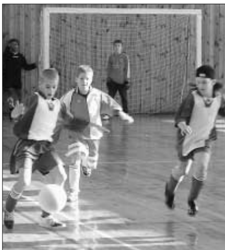
Fotografie jsou z turnaje mladších žáků ve Zdicích.

V neděli 12. února se konalo finále dorosteckých mužstev, které se hrálo na umělé ploše