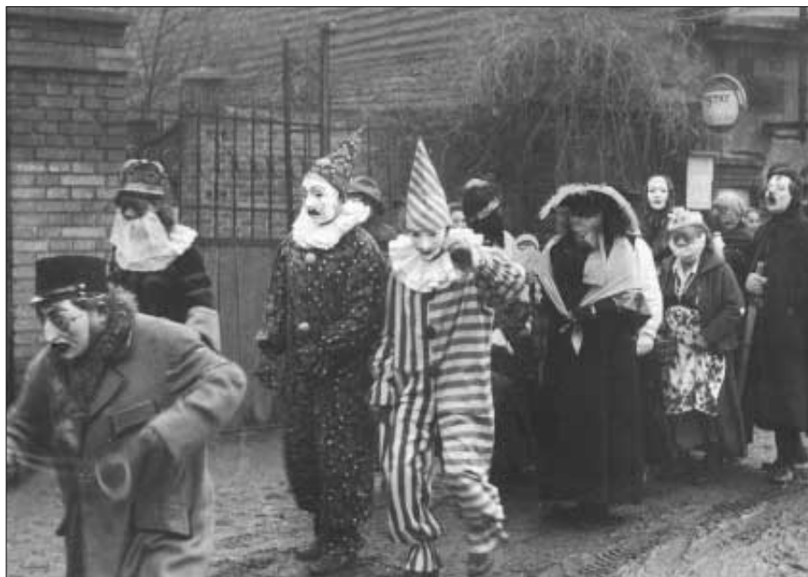
Snímkem připomínáme oslavu masopustu v Černíně před 40 lety, konala se přesně 19. února 1966.

Pro veřejnost je výstava otevřena od 10.00 do 15.00 hodin, kdy bude vyhlášení výsledků a ukončení výstavy.