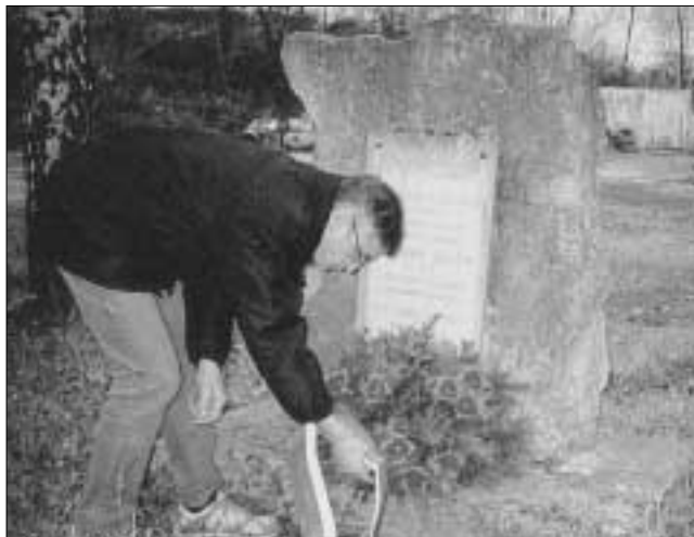
U příležitosti 86. výročí vzniku Československa byly položeny 27. října květiny k pomníkům obětí světových válek. Byl mezi nimi i pomník, který byl odhalený 15. 6. 1947 horníkům dolu Hrouda unučným za 2. světové války.

pondělí 13 - 17 hodin (dospělí) středa 12 - 16 hodin (děti) čtvrtek 13 - 17 hodin (dospělí) pátek 8 - 12 hodin (dospělí)