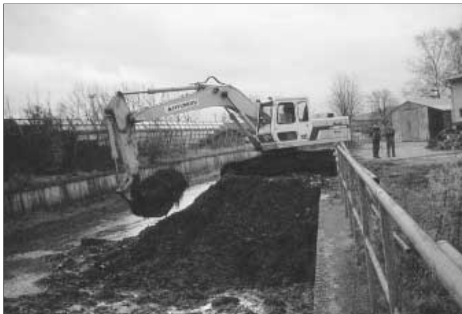
Povodí Vltavy - závod Berounka - zajistilo čištění koryta Červeného potoka. Práce provádí firma Ingpro.