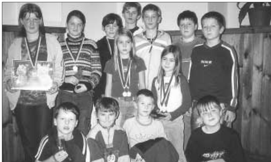
Na šachovém turnaji Přebor města Zdice byli hráči TJ Lokomotiva Zdice úspěšní. Spokojenost vládla hlavně mezi držiteli medailí.