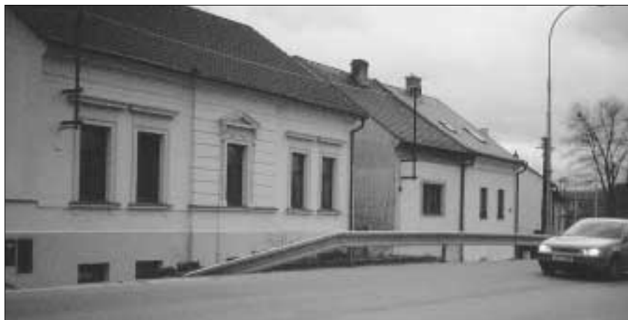
Nová svodidla instalovaná v nebezpečné zatáčce v Komenské ulici.

Samozřejmě, že se podobně jako v životě každého z nás některé věci podaří uskutečnit dříve, některé později, některé vůbec. Tak je to i v životě našeho města, kde bychom se v další části volebního období chtěli ještě více zaměřit na zlepšení vzhledu a čistoty města, omezit projevy vandalství. Důležitým úkolem, který se zatím nepodařilo splnit, je přivést do průmyslové zóny dalšího většího investora s výrobním programem.