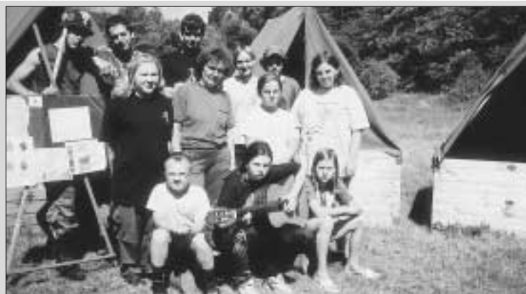
Zdičtí skauti mají za sebou už dvanáctý letní tábor. Ten letošní, opět tří-týdenní, prožili ve stanech na louce za Hředlemi.