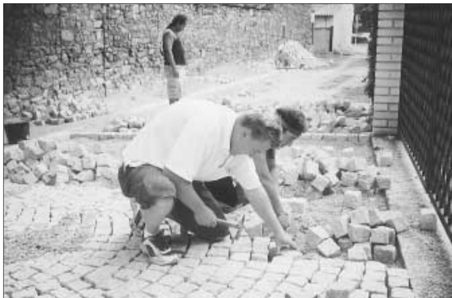
Dláždění spodní části Barákovy ulice bylo svěřeno firmě STRABAG.

Nový povrch Poncarovy ulice, který byl proveden v jarních měsících letošního roku, dal ulici pěkný konečný ráz. Na dokončení úpravy čekala pouze horní část ulice, kde bylo nutné nejdříve provést přeložku kabelů vysokého napětí. Po provedené přeložce firmou byla i tato část ulice již upravena.