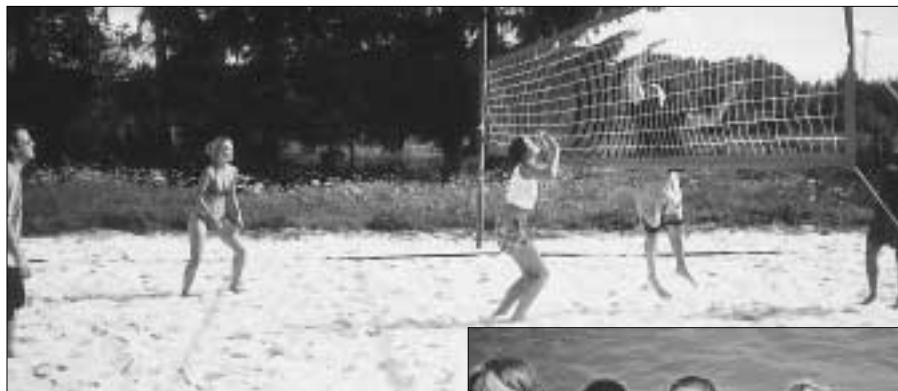
Hřiště na plážový volejbal bylo na zdickém koupališti stále využíváno. Nešlo sice o medaile, ale hrálo se naplno.

Nejmenší návštěvníci koupaliště byli spokojeni v malém bazénu. Pro ZN ochotně zapožovali, nechyběl ani úsměv se slovíčkem "sýr".