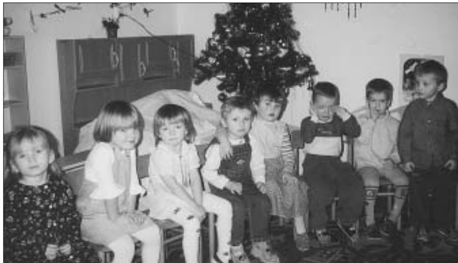
Vánoční besídka se dětem v Mateřské škole v Zahradní ulici moc povedla a byla navštívena spoustou rodičů. Na snímku nejmladší děti před zahájením besídky.