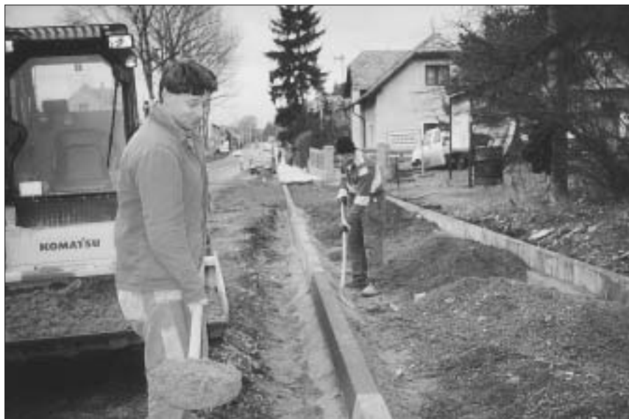
Na snímku pracovníci firmy Strabag, která prováděla v prosinci opravu v části Komenského ulice. Počasí pracovníkům firmy v závěru prací vůbec nepřálo, přesto stihli zadaný úkol dokončit.

Po několikaleté přestávce je městský rozhlas v provozu. Realizaci bezdrátového rozhlasu provedla firma MICROTREC z Přelouče. Rozhlas je zaveden nejen ve Zdicích, ale také v Knížkovicích a Černíně. Zatím je rozhlas v šestiměsíčním zkušebním provozu a jeho funkce bude podle potřeby ještě vylepšována. - sm -