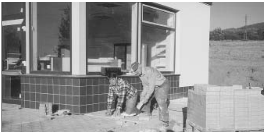
Firma STAFIN projekty a stavby, s.r.o. Plzeň prováděla v letních měsících ve Zdicích opravu čerpací stanice ČEPRO, a.s. Praha. Kolaudační řízení se uskutečnilo 23. září 2003. Snímek z 19. září je ještě z dokončovacích stavebních prací.