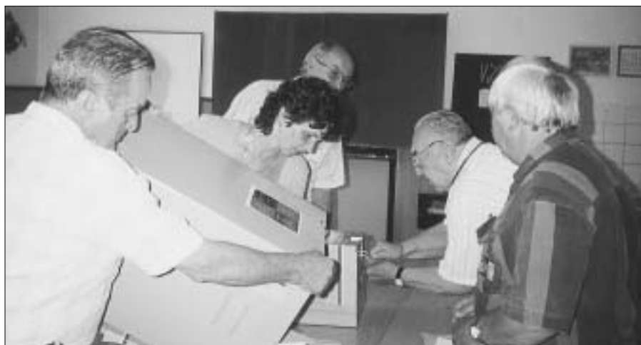
Nastává závěrečná práce volební komise - zjistit výsledky hlasování občanů. Snímek je z volebního okrsku Zdice - stará škola