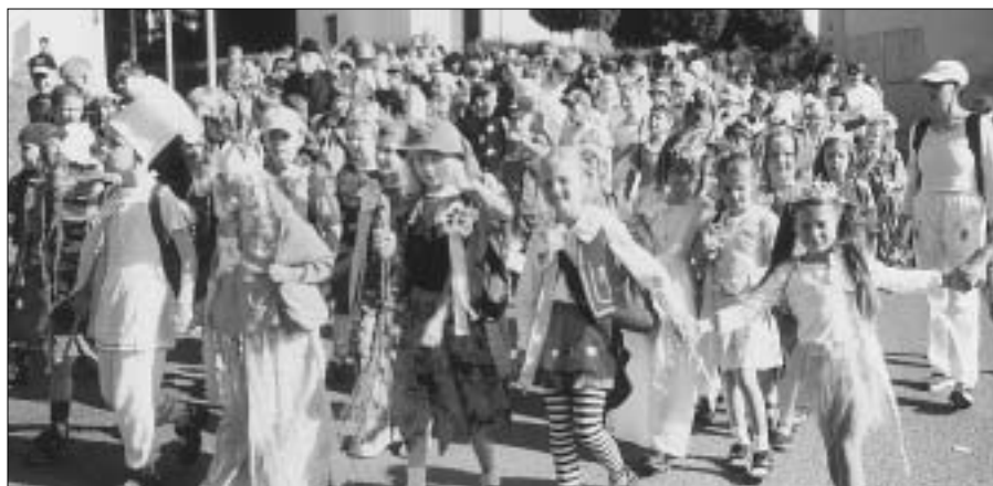
Den dětí, který pořádá ZŠ, se ani letos neobešel bez průvodů dětí v pestrých maskách. Od národní školy prošel průvod za doprovodu kapely městem až na koupaliště, kde děti čekal bohatý program.