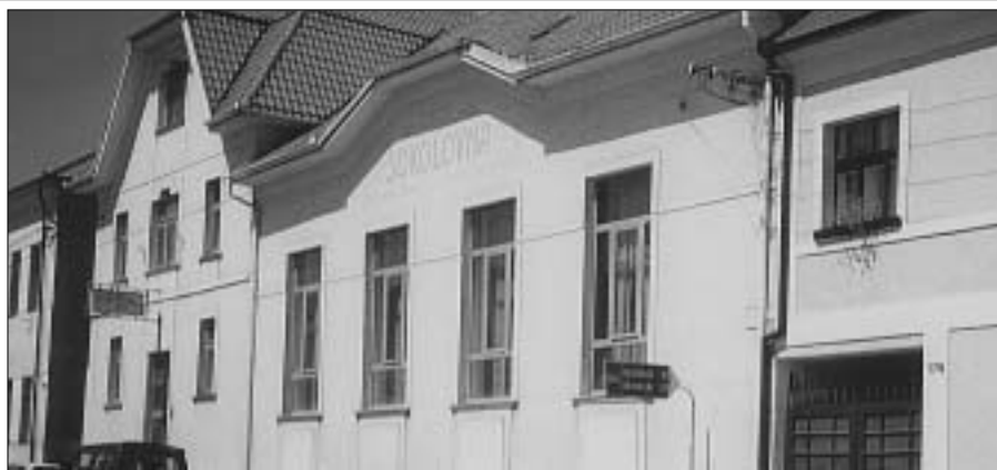
Sokolovna ve Zdicích byla postavena v r. 1914. Dnes slouží jako Společenský dům. Původní účel připomíná nápis nad okny budovy.