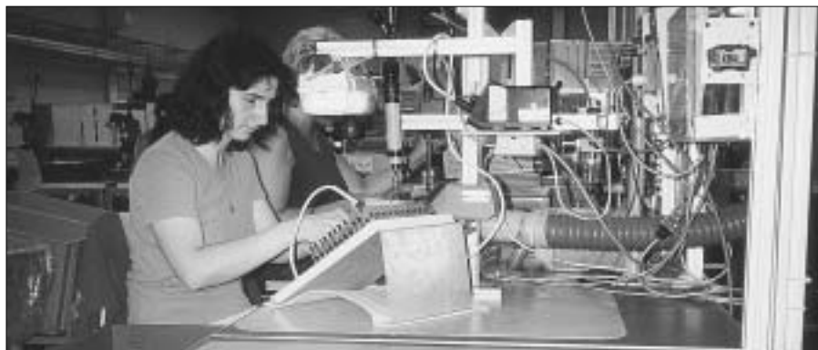
Nový moderní závod KOSTAL umožní stovkám lidí najít pracovní příležitost. Na snímku záběr na pracovišti výrobní linky.