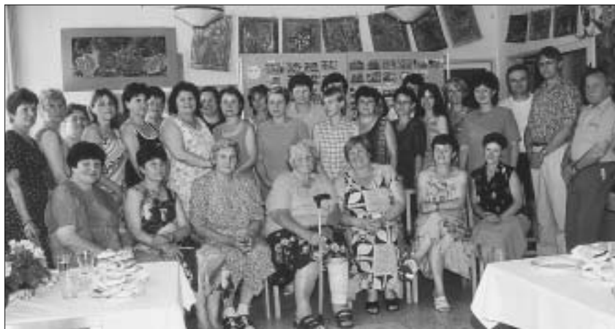
Na snímku účastníci setkání, které se konalo u příležitosti 25. výročí otevření Mateřské školy Zdice, Zahradní ulice.

Sokolovna měla ještě jeden zanedbatelný význam. Projektant velmi dobře pamatoval i na kulturní využití objektu realizací jeviště i přilehlých prostor, včetně balkonu. Od roku 1893 existoval ve Zdicích divadelní soubor Sokola, který měl od otevření budovy svůj důstojný stánek. Na prknech jeviště vystoupily divadelní soubory Palacký, DTJ, Sboru dobrovolných hasičů i Baráčeknické obce. V roce 1923 vznikl navíc při Obci sokolské dětský divadelní soubor, který až do roku 1948 hrál pro nejmenší pohádková