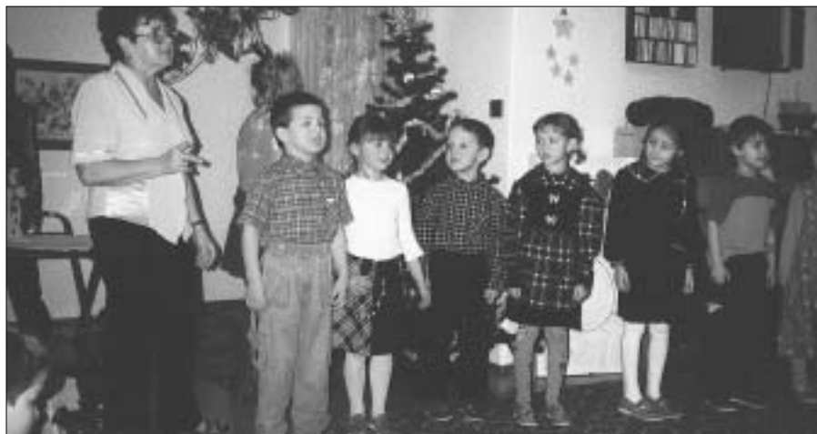
12. prosince se uskutečnila vánoční besídka v obou MŠ. Zdické noviny přinášejí tentokrát snímek z MŠ v Žižkově ulici. Vystoupení dětí se všem přítomným moc líbilo. Na závěr čekaly na děti pěkné dárky.

V minulém čísle ZN si v článku "Zasedání rady města" zařadil tiskařský šotek. Na havárii kotle ve školní jídelně MŠ II bylo poskytnuto 85.000,- Kč, ne pouhých 35.000,- Kč. Čtenářům se omlouváme.